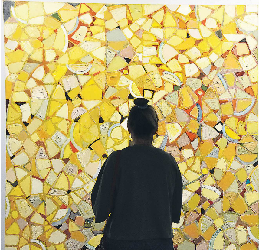
Серия «Фуги», автор Павел Ходаев

Для нас открытие этого зала – очень волнительное событие, потому что это одно из последних наших инфраструктурных расширений, происходящих в последние несколько лет. В 2015 году у нас открылся Музей naïвного искусства, затем фондохранилище, центр «Эрмитаж-Урал» и