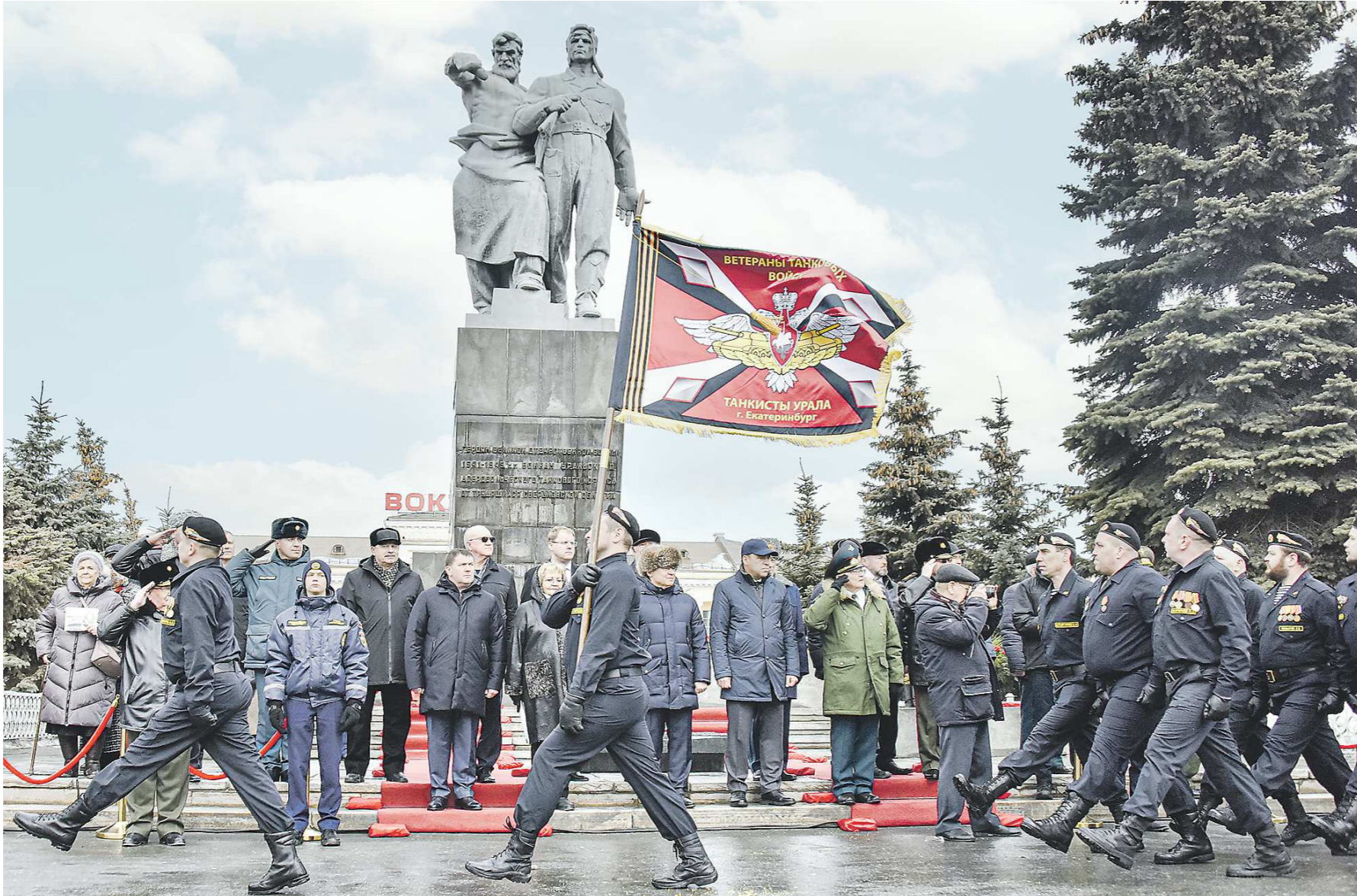
Традиционно торжественные мероприятия в Екатеринбурге начинаются у памятника воинам Уральского добровольческого танкового корпуса

В этот же день в Театре Эстрады прошло торжественное собрание. Ему предшествовал вынос знамени УДТК (копии, боевое знамя хранится в Музее Победы в Москве в числе других знамен Великой Отечественной войны – «ОГ»). «Славное воинское соединение родилось от воли, труда и мужества наших земляков. Из любви к Отчизне и искренней готовности уральцев отдать все, даже саму жизнь, во имя победы, во имя свободы и независимости нашей великой страны. История создания Уральского добровольческого танкового корпуса – одна из золотых страниц в летописи нашего региона. Тех, кто создавал славу опорного края державы. Это пример добровольчества в самом высоком смысле этого слова, на который уральцы равняются и сегодня», – сказал Евгений Куйвашев.