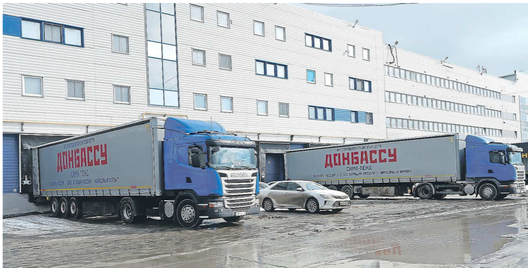
В пути гуманитарному конвою в зону спецоперации предстоит провести трое суток

ДЕНЬ НАРОДНОГО ПОДВИГА по формированию Уральского добровольческого танкового корпуса в годы Великой Отечественной войны