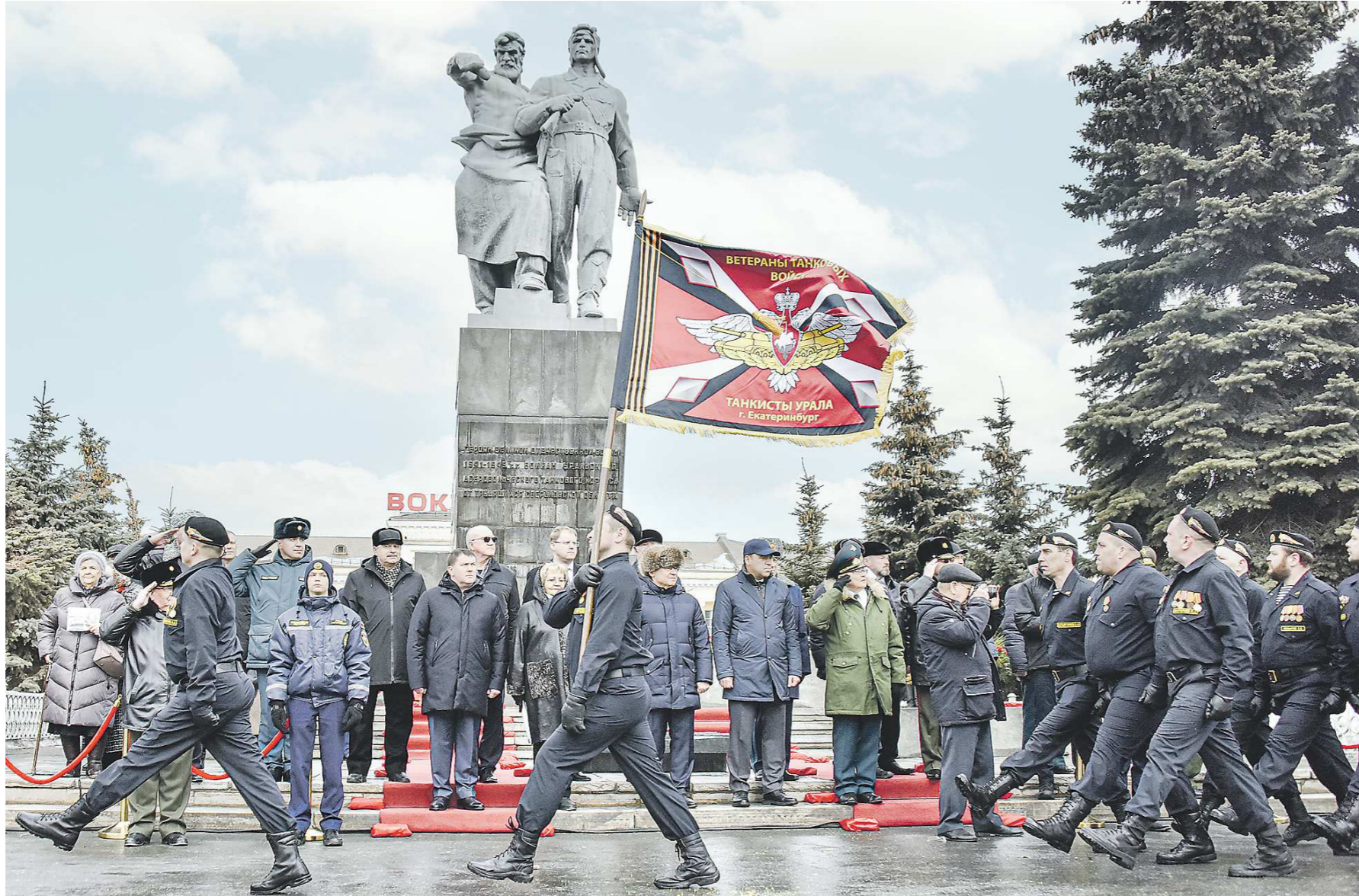
Традиционно торжественные мероприятия в Екатеринбурге начинаются у памятника воинам Уральского добровольческого танкового корпуса

В этот же день в Театре Эстрады прошло торжественное собрание. Ему предшествовал вынос знамени УДТК (копии, боевое знамя хранится в Музее Победы в Москве в числе других знамен Великой Отечественной войны – «ОГ»). «Славное воинское соединение родилось от воли, труда и мужества наших земляков. Из любви к Отчизне и искренней готовности уральцев отдать все, даже саму жизнь, во имя победы, во имя свободы и независимости нашей великой страны. История создания Уральского добровольческого танкового корпуса – одна из золотых страниц в летописи нашего региона. Тех, кто создавал славу опорного края державы. Это пример добровольчества в самом высоком смысле этого слова, на который уральцы равняются и сегодня», – сказал Евгений Куйвашев.