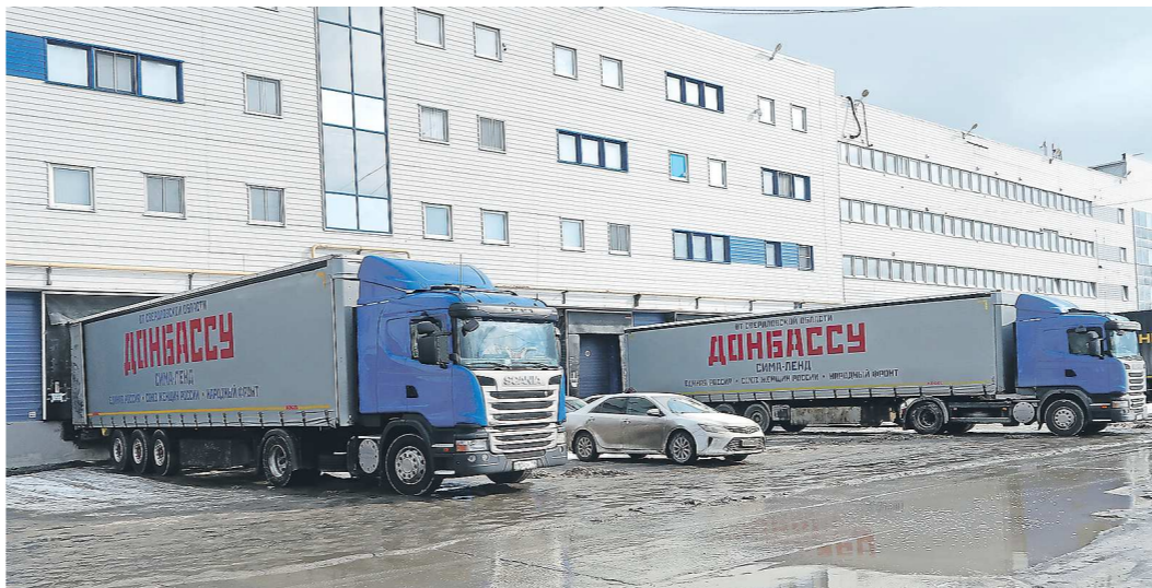
В пути гуманитарному конвою в зону спецоперации предстоит провести трое суток