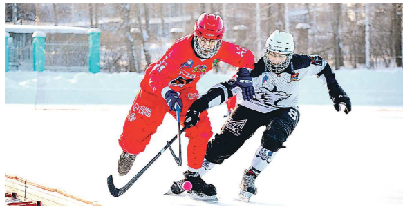
ПРЕСС-СЛУЖБА ХК «УРАЛЬСКИЙ ТРУБНИК»

В понедельник после новогодней паузы возобновился чемпионат России по хоккею с мячом. Представитель Свердловской области – «Уральский трубник» из Первоуральска – на своем поле встречался с одним из лидеров турнира – кемеровским «Кузбассом». «Трубки» выглядел гораздо лучше, чем в матче первого круга (тогда он уступил сибирякам со счетом 3:11), но все-таки опять проиграл – 1:3. Это десятое поражение первоуральцев в текущем чемпионате.