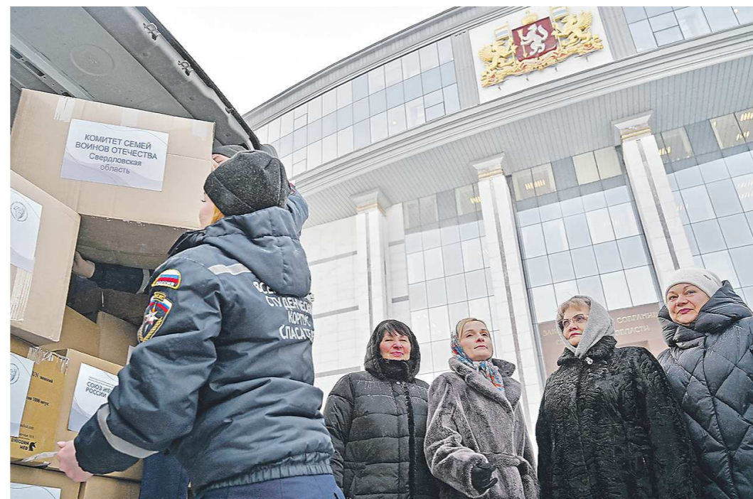
Председатель Законодательного Собрания Свердловской области Людмила Бабушкина (на фото вторая справа) выразила уверенность, что женские организации региона и впредь будут активно поддерживать нуждающихся в помощи