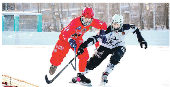
На своей площадке «Уральский трублик» навязал серьезную борьбу третьей команде нынешнего чемпионата

В понедельник после новогодней паузы возобновился чемпионат России по хоккею с мячом. Представитель Свердловской области – «Уральский трублик» из Первоуральска – на своем поле встречался с одним из лидеров турнира – кемеровским «Кузбассом».