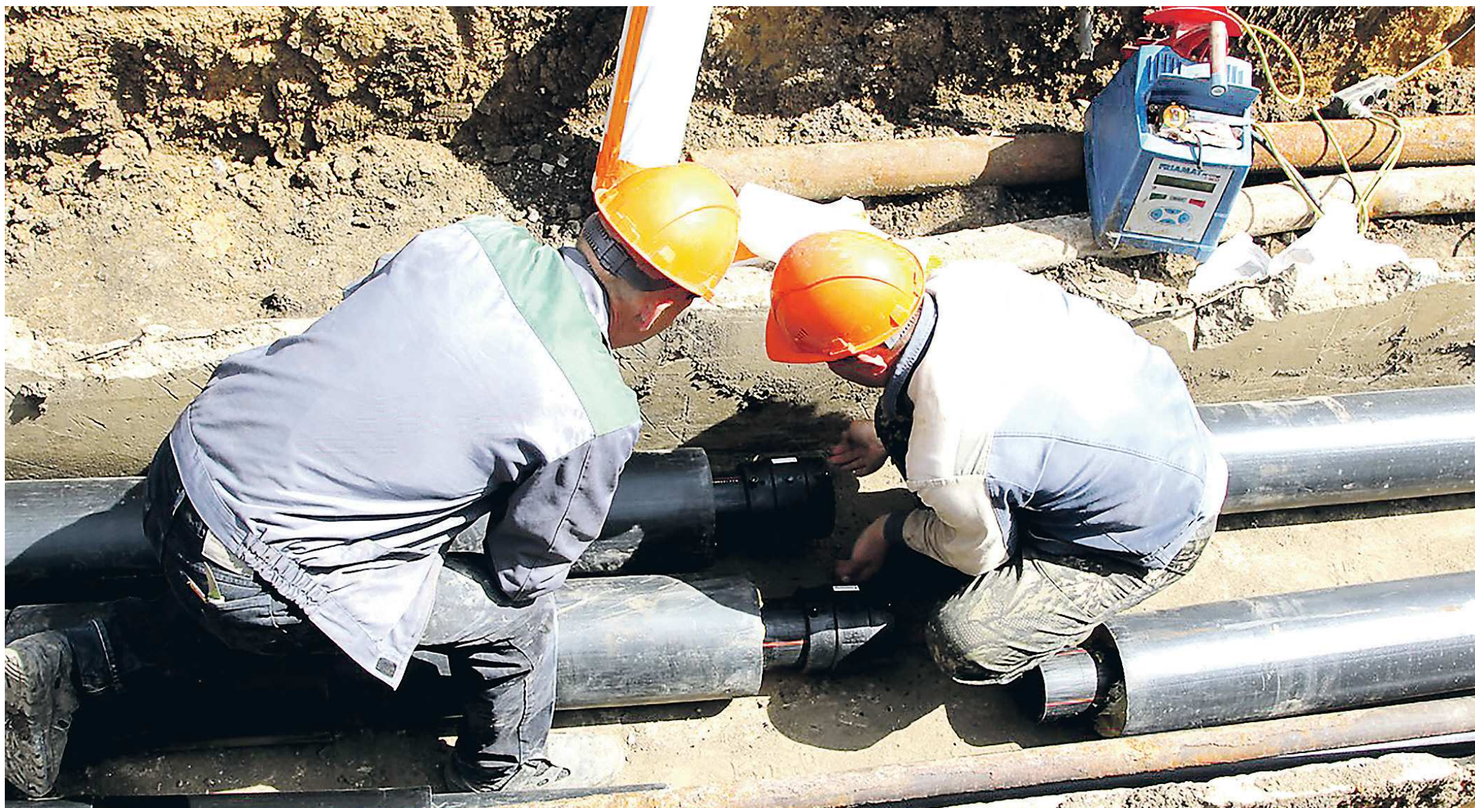
Замена ветхих коммунальных сетей в регионах – одно из ключевых направлений новой программы, инициированной Президентом