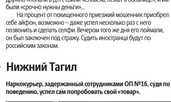
31-летний житель Кушвы, ранее неоднократно судимый за хранение наркотиков, в тот день вызвал такси, чтобы добраться из Нижнего Тагила домой. Как вспоминает таксист, клиент показался ему глубоко нетрезвым, и в районе поселка Евстоныха, встав на заправку, водитель решил уточнить, есть ли у пассажира деньги.

Наркокурьер, задержанный сотрудниками ОП №16, судя по поведению, успел сам попробовать свой «товар».