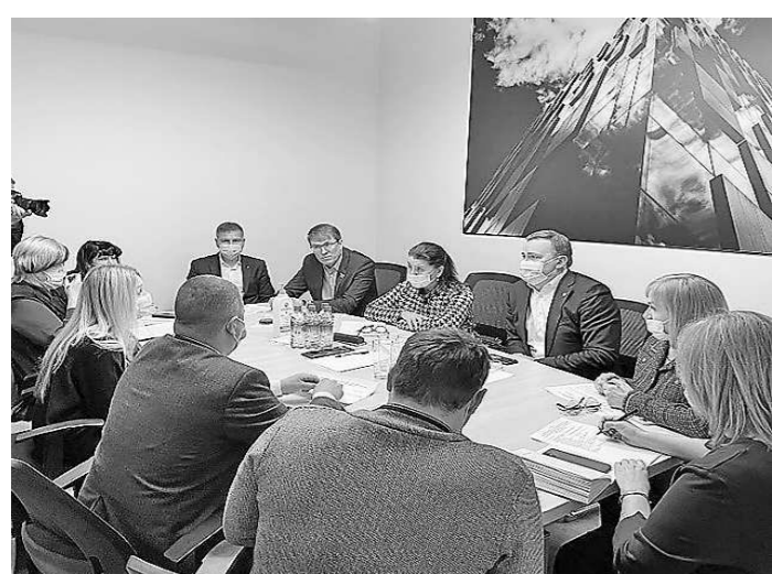
Прием с Главой города Нижний Тагил (9 марта, г. Нижний Тагил)