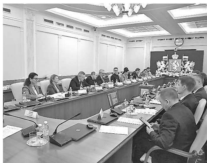
Прием с прокурором г. Каменска-Уральского (25 мая, г. Каменск-Уральский)