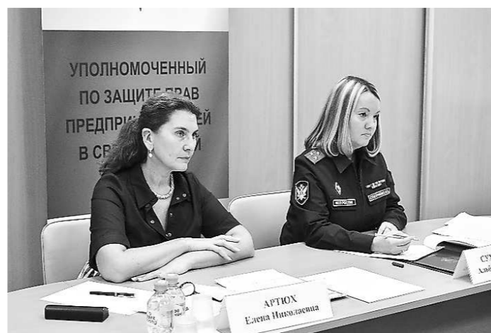
Прием с Главным Управлением Федеральной службы судебных приставов по Свердловской области (26 октября, г. Екатеринбург)