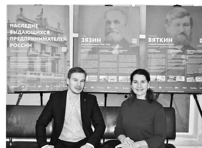
Открытие выставки «Наследие выдающихся предпринимателей России и Урала», организованной Свердловским областным отделением «ОПОРА РОССИИ» (27 декабря, г. Екатеринбург) (Окончание на 20-й стр.).