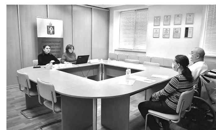
Обсуждение системных проблем с субъектами предпринимательской деятельности – маломобильными гражданами (9 ноября, г. Екатеринбург)