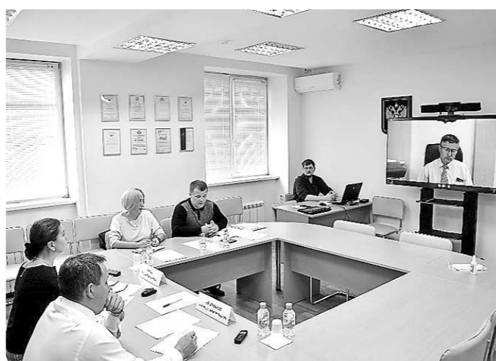
Прием с Управлением Роспотребнадзора по Свердловской области по ВКС (8 сентября, г. Екатеринбург)