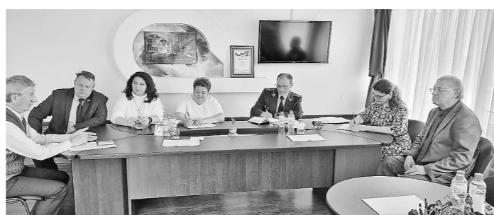
Прием с представителями ГУ МВД России по Свердловской области (16 ноября, г. Екатеринбург)