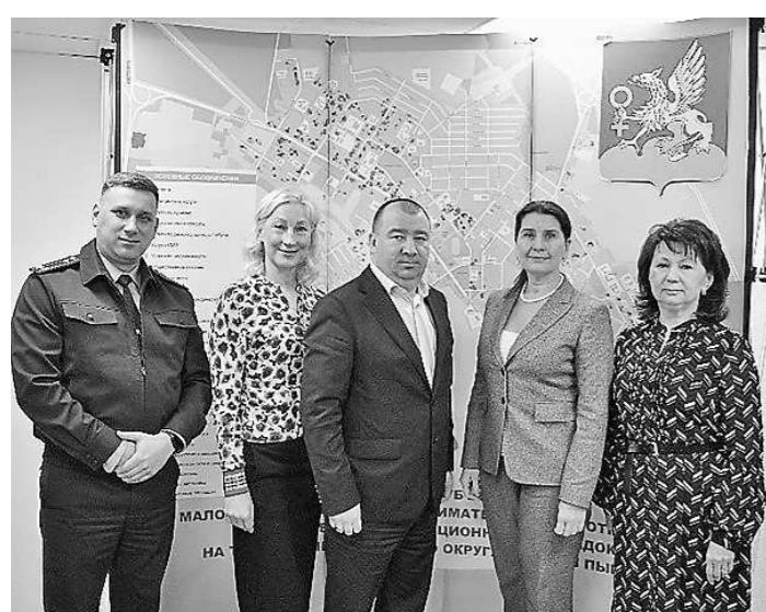
Прием с и.о. прокурора города Верхняя Пышма и Главой городского округа Верхняя Пышма (31 марта, г. Верхняя Пышма)