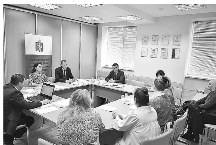
Рабочее совещание с общественными помощниками Уполномоченного (27 июля, г. Екатеринбург)