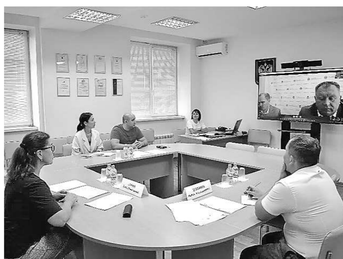
Расширенное заседание общественного экспертного совета при Уполномоченном (29 марта, г. Екатеринбург)