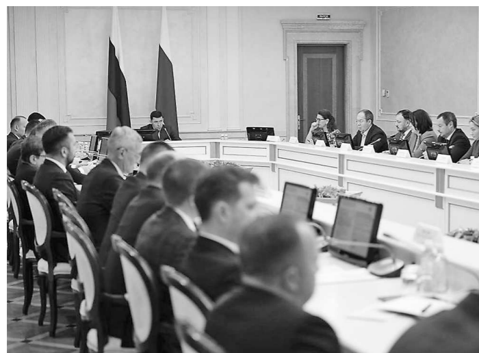
Заседание Инвестиционного комитета Свердловской области (6 декабря, г. Екатеринбург)