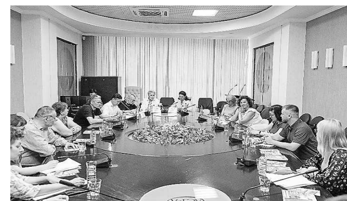
Встреча с предпринимателями – членами Ассоциации «Товароведы-менеджеры Екатеринбург» (15 июля, г. Екатеринбург)