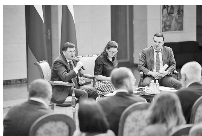
Встреча с собственниками и руководителями субъектов МСП (26 мая, г. Екатеринбург)