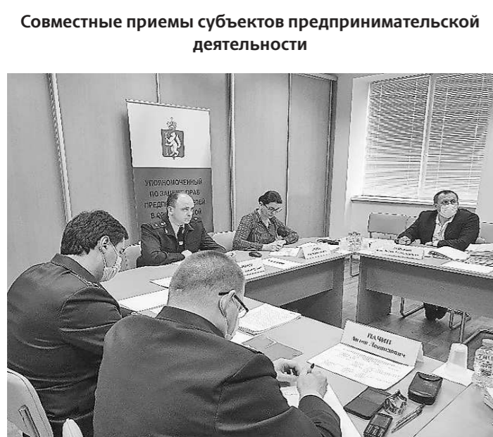
Прием с прокурором Свердловской области (21 февраля, г. Екатеринбург)