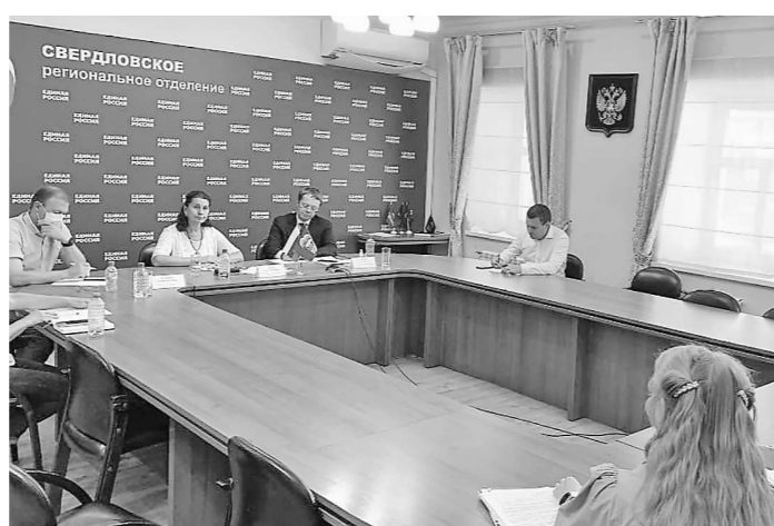
Прием в Региональной общественной приемной Председателя партии Д.А. Медведева в Свердловской области (25 июля, г. Екатеринбург)