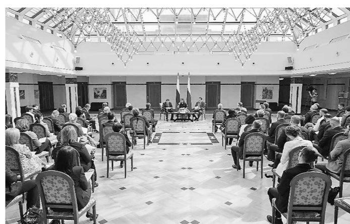
Встреча с собственниками и руководителями субъектов МСП (26 мая, г. Екатеринбург)