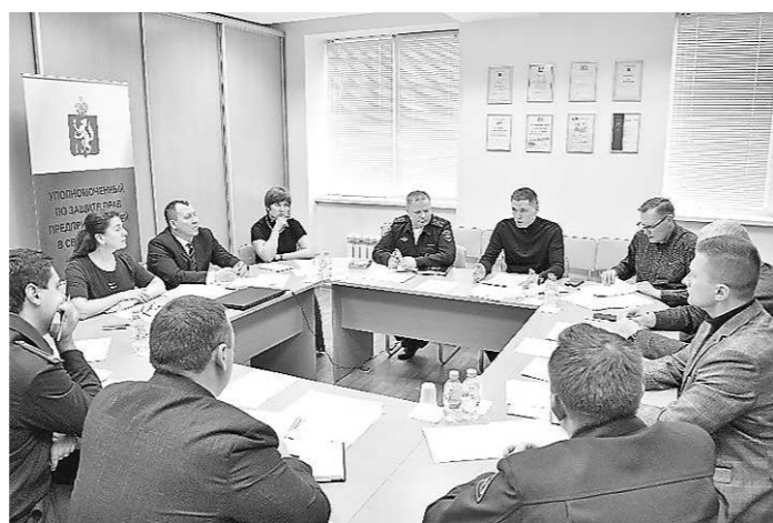
Тематический коллективный прием по вопросам контроля оформления сопроводительных документов на транспортировку древесины (20 апреля, г. Екатеринбург)