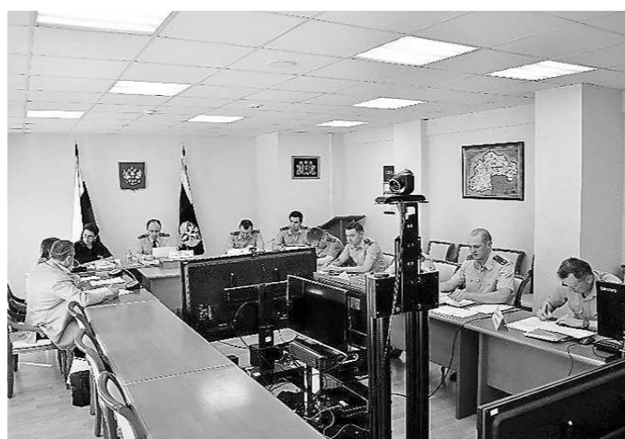
Прием с прокурором Свердловской области (22 июля, г. Екатеринбург)