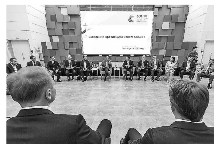
Заседание Президиума Совета СОСПП с участием Губернатора Свердловской области (24 августа, г. Екатеринбург)