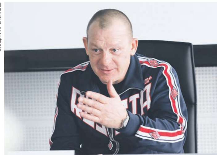
Дмитрий Саутин не жалеет на пресс-конференции восторженных слов: «Огромные молодцы, Дворец великолепен. Столь масштабно не оснащены даже объекты, в которых проходили чемпионаты мира и Европы. Это высочайший уровень, а благодаря строителям за этот спортивный шедевр»

Дмитрий Саутин выделил трамплины и вышки. Даже