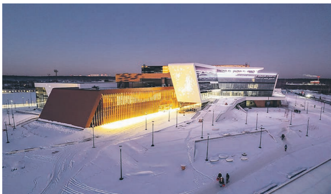
Екатеринбургский Дворец водных видов спорта готов на 98 процентов. Сдать его планируется в марте

Новый спортивный объект рассчитан на проведение соревнований по четырем видам спорта: плаванию, синхронному плаванию, прыжкам в воду и водному поло.