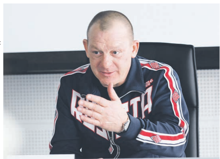
Дмитрий Саутин не жалел на пресс-конференции восторженных слов: «Огромные молодцы, Дворец великолепен. Столь масштабно не оснащены даже объекты, в которых проходили чемпионаты мира и Европы. Это высочайший уровень, а благодаря строителям за этот спортивный шедевр»

Дмитрий Саутин выделил трамплины и вышки. Даже