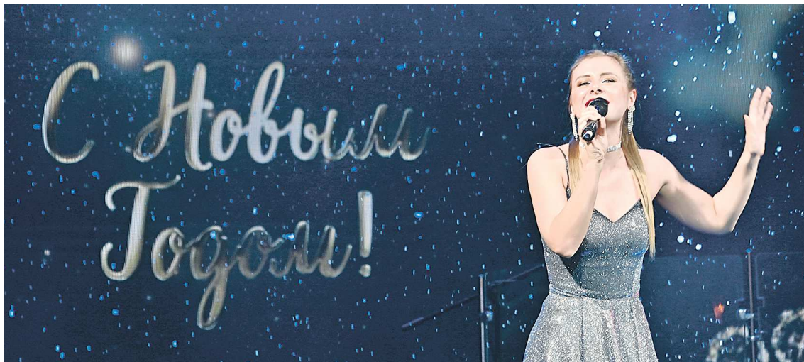
Шоу «Новогодняя Теле.Ёлка» будет показано 31 декабря в 22:00. После этого в эфир выйдет новый проект «Бесконечное поздравление» от жителей Свердловской области

– Я с нетерпением жду нового года – его начало обещает быть фееричным: стартует зимний сезон по хоккею на траве, а в старый Новый год будет концерт группы «ТОП». А даль-