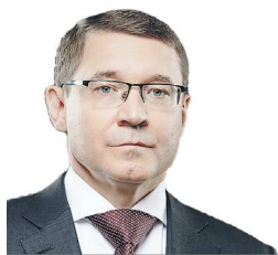
Полномочный представитель Президента России в Уральском федеральном округе

Желаю вам крепкого здоровья, счастья, благополучия, оптимизма и дальнейших успехов в вашей ответственной работе!