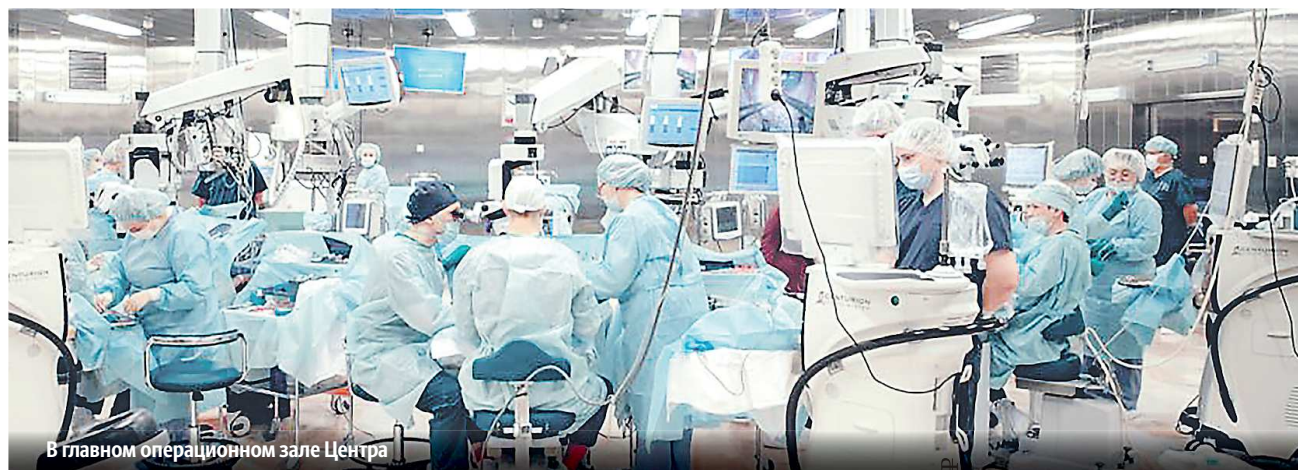
В главном операционном зале Центра

ЕКАТЕРИНБУРГСКИЙ ЦЕНТР МНТК «МИКРОХИРУРГИЯ ГЛАЗА»