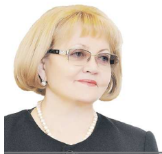
Председатель Законодательного Собрания Свердловской области

Желаю всем, чья жизнь связана с энергетикой, всего самого доброго: счастья, благополучия, здоровья. И пусть как можно меньше случается внештатных ситуаций! С праздником!