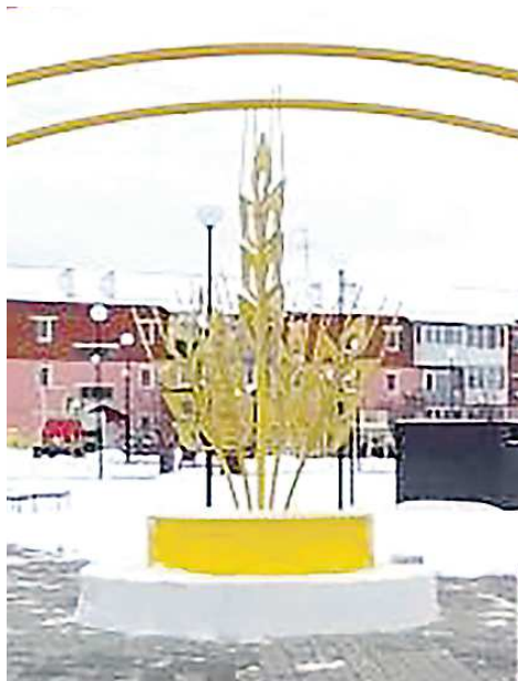
Световой фонтан в виде колосьев отсылает к сельскохозяйственной тематике

На территории обустроены площадки для воркаута, мини-футбола, баскетбола, установлены спортивные тренажеры и две детские площадки – в виде комбайна и мельницы. Кроме того, здесь обустроены парковка и мемориал славы павшим в годы Великой Отечественной войны. Возле Дома культуры установлены сцена и световая арка.