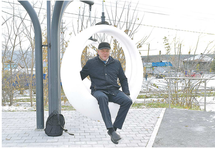
Глава Верхотурского городского округа Алексей Лиханов в новом парке

Спуск к реке находился в изношенном состоянии, были разрушены ступени и деформировано ограждение. Кроме того, отсутствовал доступ для маломобильных групп населения. Благодаря реализации проекта теперь эта территория, безусловно, станет местом притяжения для жителей города и его го-