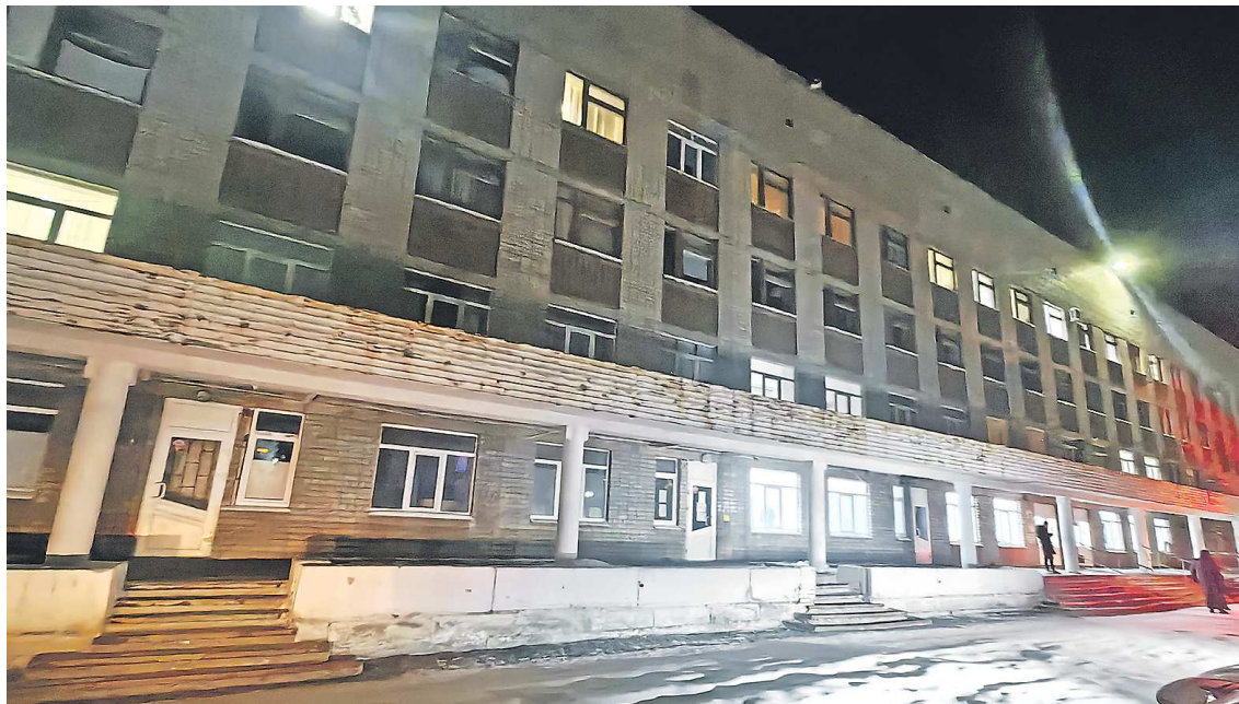
Больница в Рефтинском месяц назад стала частью крупного межмуниципального центра. Это позволит повысить качество медицинской помощи, оказываемой жителям поселка