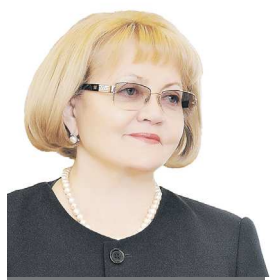
Людмила БАБУШКИНА, председатель Законодательного Собрания Свердловской области:

— В ходе Прямой линии с гражданами и большой пресс-конференции с представителями СМИ Президент Российской Федерации Владимир Владимирович Путин обозначил важнейшие задачи, стоящие перед нашей страной. Прежде всего это укрепление суверенитета.