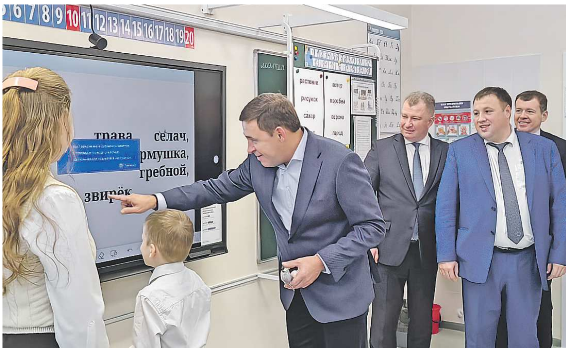
Евгений Куйвашев лично поучаствовал в организации образовательного процесса в новой школе

Евгений Куйвашев совершил рабочую поездку на север области