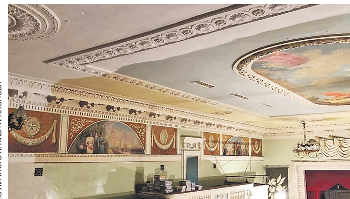
Так лепнина и фрески выглядят сегодня

В Карпинске за два года отремонтируют Дом культуры угольщиков. В нем появится музыкальное отделение Детской школы искусств. Проект поддержал губернатор Евгений КУЙВАШЕВ. Первый этап ремонтных работ стоимостью 70 млн рублей начнется в следующем году.