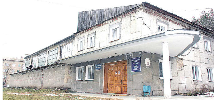
Летом 2023 года в спортивном зале школы «Олимп» проходил внутренний ремонт, теперь обновят и внешний облик здания

Поскольку протяженность участка достаточно большая,