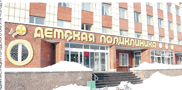
В детской поликлинике также продолжается ремонт бассейна

В Лесном после масштабной реконструкции открыт первый этаж детской поликлиники. С весны текущего года здесь шли работы в рамках проекта «Совершенствование доступности и качества медицинской помощи в городах присутствия Госкорпорации «Росатом».