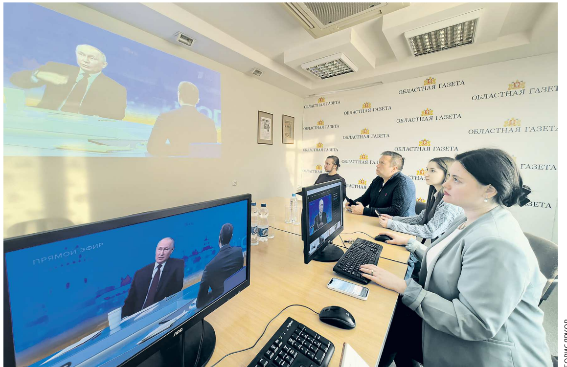
Журналисты «Областной газеты» в редакции смотрят и обсуждают Прямую линию с Владимиром Путиным

И, конечно, мы гордимся нашим Президентом и поддержим его на выборах.