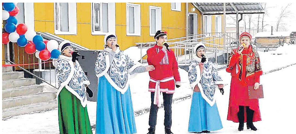
На открытии выступили местные творческие коллективы

В него заехали переселенцы из ветхого, аварийного жилья