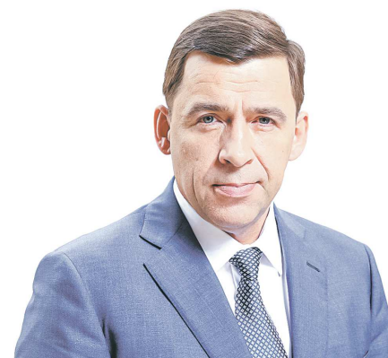
Евгений КУЙВАШЕВ, губернатор Свердловской области