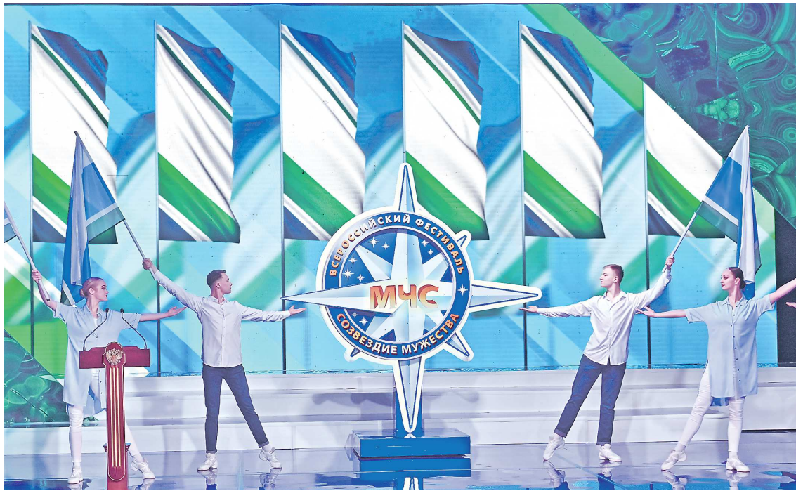
Фестиваль «Созвездие мужества» – самая масштабная общественная акция МЧС России

– Я долгое время готовился, это было моей целью с момента поступления на службу в 2012 году. Я всю жизнь занимаюсь спортом, он помогает становиться лучше, двигаться вперед, побеждать. Во время службы постоянно совершенствовал физическую и пожарно-строевую подготовку, теоретические знания. Надеюсь,