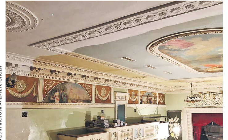
Так лепнина и фрески выглядят сегодня

В Карпинске за два года отремонтируют Дом культуры угольщиков. В нем появится музыкальное отделение Детской школы искусств. Проект поддержал губернатор Евгений КУЙВАШЕВ. Первый этап ремонтных работ стоимостью 70 млн рублей начнется в следующем году.