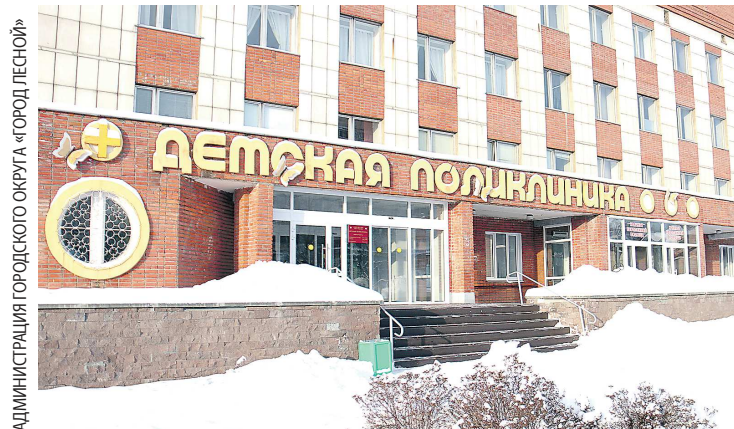
В детской поликлинике также продолжается ремонт бассейна

В Лесном после масштабной реконструкции открыт первый этаж детской поликлиники. С весны текущего года здесь шли работы в рамках проекта «Совершенствование доступности и качества медицинской помощи в городах присутствия Госкорпорации «Росатом».