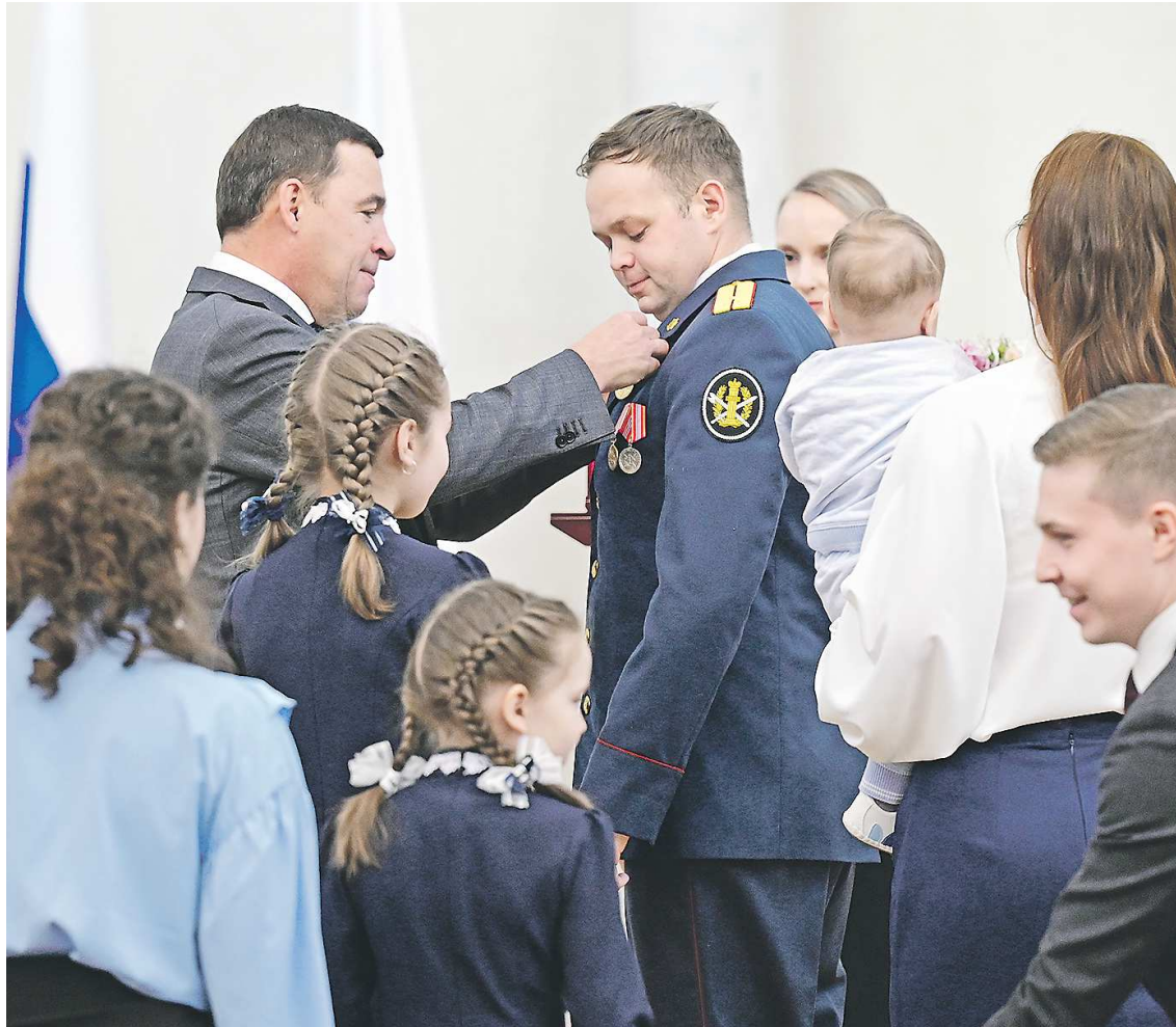
Сразу три семейные пары были удостоены медалей ордена «Родительская слава»