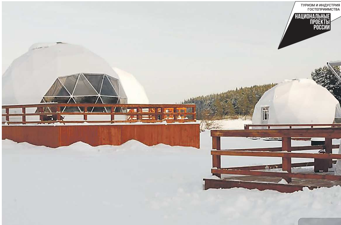
В глэмпинге есть геокуполы с панорамным видом на знаменитую скалу Кликун-камень

В Верхотурье в декабре откроется внесезонный глэмпинг