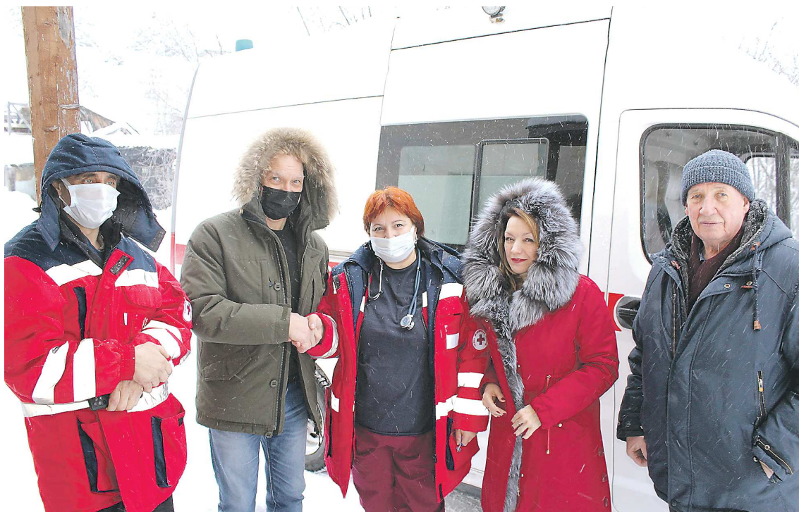
Команда скорой помощи приступила к работе

Нашлось место и для стоянки реанимобиля – город-