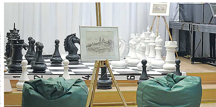
Глава Алексей Лиханов отмечает, что в городском округе активно развивают шахматный спорт

В Верхотурской детской школе искусств создана территория для проведения культурного досуга. Проект стоимостью 560 тысяч рублей реализован с помощью механизма инициативного бюджетирования. Одна из «фишек» проекта – уличные шахматы.