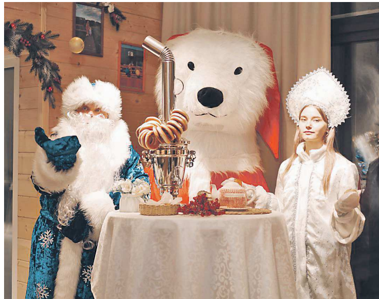
Комплекс готов к приему гостей

— Это очень хороший пример сотрудничества государства с бизнесом в направлении развития туристической индустрии. Знаю, что многих туристов останавливало от по-