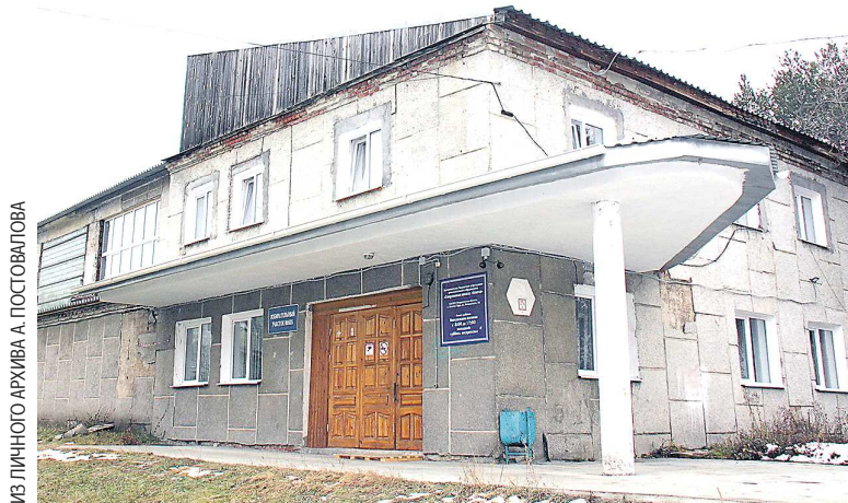
Летом 2023 года в спортивном зале школы «Олимп» проходил внутренний ремонт, теперь обновят и внешний облик здания

Поскольку протяженность участка достаточно большая, работы разделены на несколько этапов. Сейчас Нижнетуринские тепловые сети приступи-