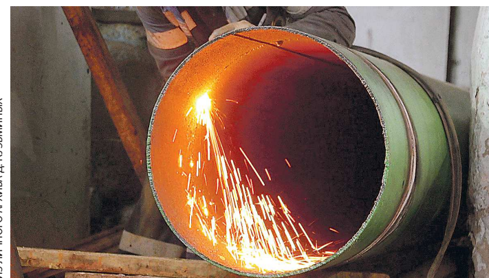
Работами по обеспечению жителей качественной водой в городском округе занялись еще летом