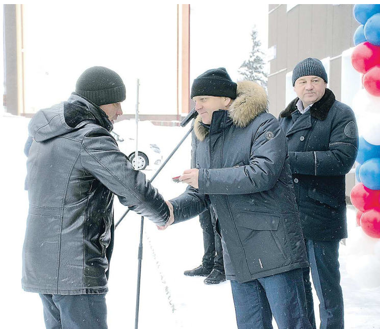
Глава городского округа вручает ключи новым жильцам

– К сожалению, у нас большинство домов строилось в послевоенный период. Объем ветхого жилья большой, еже-