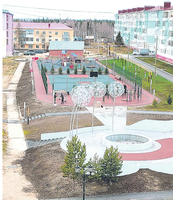
Благодаря проекту на заболоченном участке появилась современная общественная территория

Также на территории обустроили беговую дорожку с прорезиненным покрытием, установили полукруглые скамейки в виде солнечных лучей. Кроме того, на площади смонтирована система освещения и высажены новые деревья.