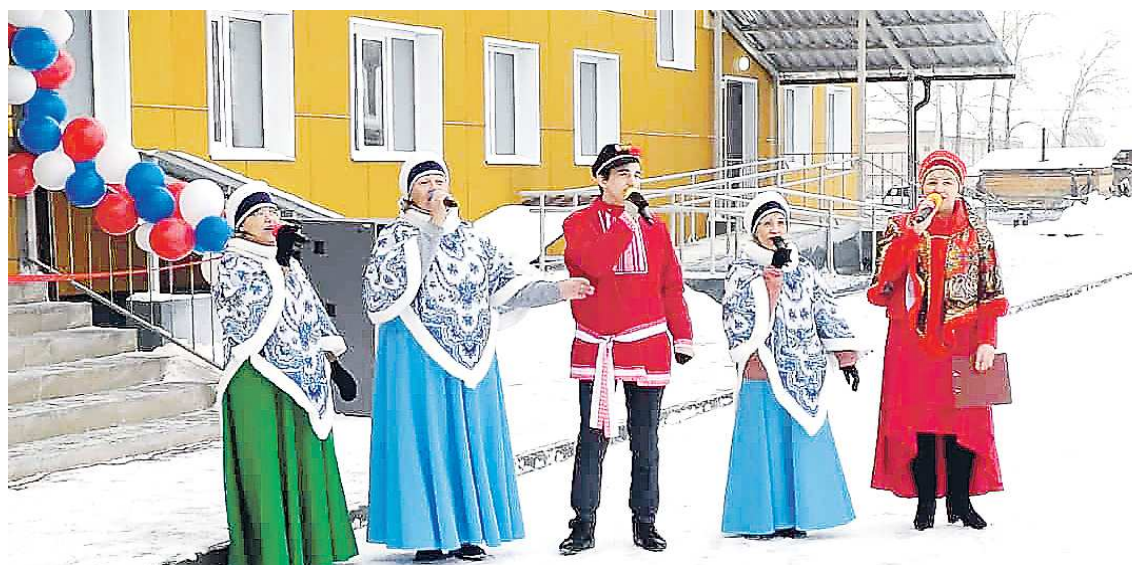
На открытии выступили местные творческие коллективы