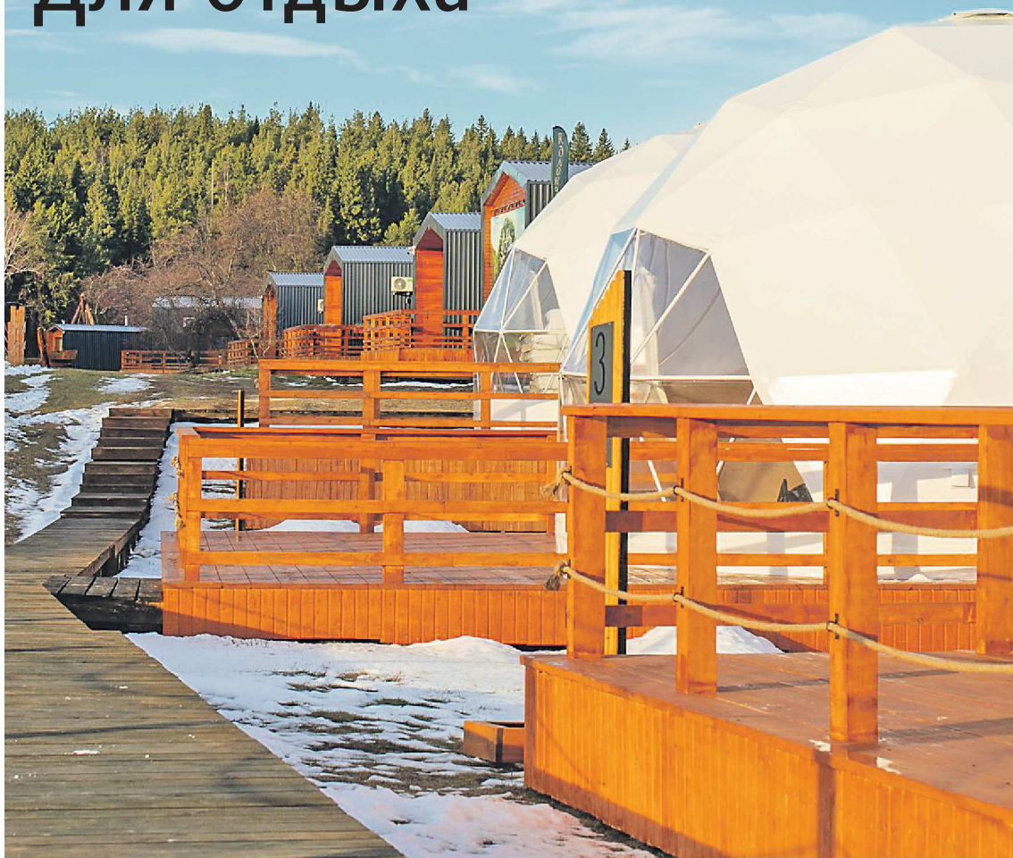
СТРАНИЦА В СОЦИАЛЬНЫХ СЕТЯХ ЗАГОРОДНОГО КЛУБА «ЯБЛОЧНЕВЫЙ САД»