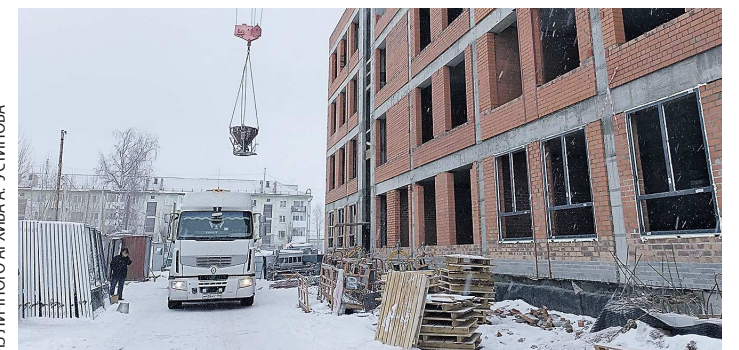
В следующем учебном году ученики услышат первый звонок уже в стенах новой школы

Открыть ее планируется к сентябрю 2024 года