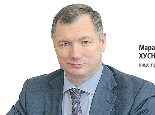
Марат ХУШНУЛЛИН, вице-премьер РФ

“ Развитие регионов и муниципалитетов в сегодняшних экономических реалиях является одной из наших основных задач – и определение точек роста, и определение тех внутренних источников, за счет чего экономика страны будет развиваться и жизнь людей будет улучшаться.