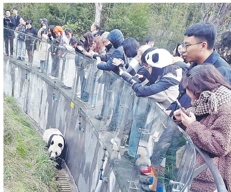
Панда Оreo в Долине панд Дуцзяньяна