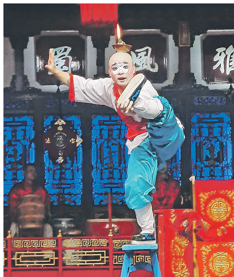
Акробат в народной одежде – участник представления в Сычуаньской опере