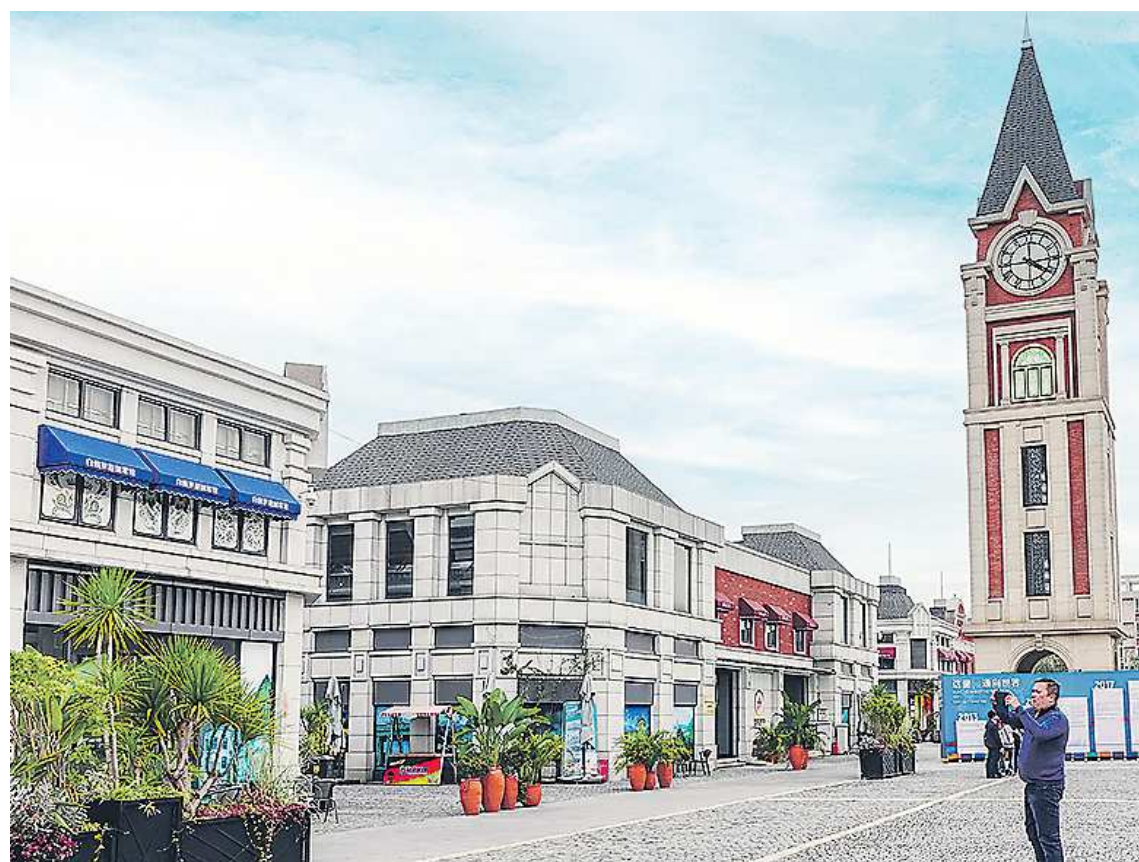
«Городок дьюти-фри» рядом с Международным железнодорожным грузовым портом в Чэнду