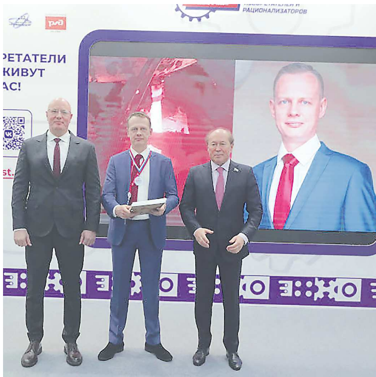
В жюри конкурса ВОИР вошли ученые и исследователи, представители промышленности и другие эксперты

ставил проект по модернизации огнеупорных материалов. Благодаря более долгой эксплуатации материалов удалось снизить себестоимость и повысить производительность агрегатов, а также значительно улучшить качество изготавливаемой на заводе стали. Экономический эффект разработки уже составил более 500 миллионов рублей.