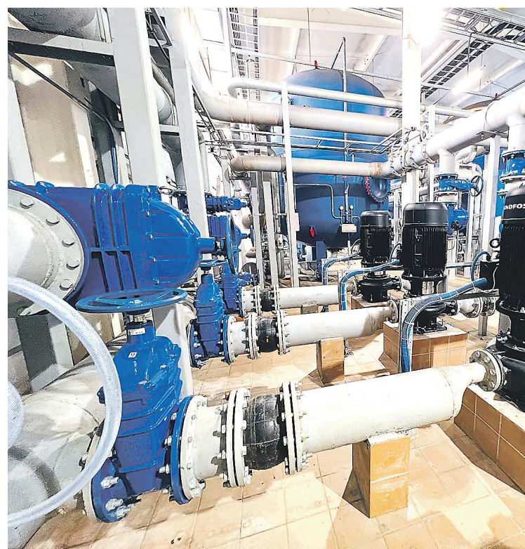
Жители начали получать чистую питьевую воду в конце ноября

АДМИНИСТРАЦИЯ КУШВИНСКОГО ГОРОДСКОГО ОКРУГА