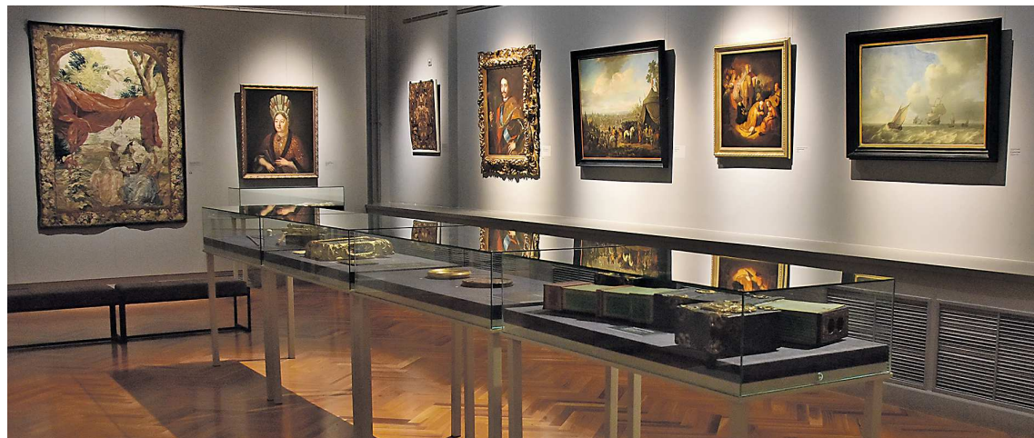
Шпалера XVIII века, подзорная труба, планшет геодезический, солнечные часы, трость с вкладной мерой длины, шкатулка-сейф... За каждым экспонатом – своя любопытная история