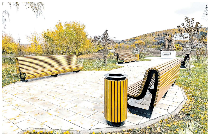
Площадки в районе «Рига» после благоустройства открыли осенью

Верхней Туре выделяют 1,3 миллиона рублей на проведение дополнительных работ по благоустройству территории в районе «Рига». Над проектом работали с весны этого года.