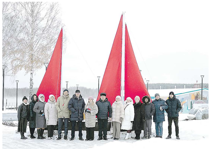
Яркий арт-объект стал красочным символом возрождения традиций города