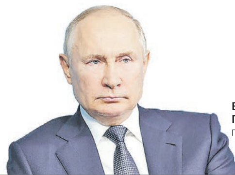
Владимир ПУТИН, Президент России

ДЕПАРТАМЕНТ ИНФОРМАТИКИ СВЕРДЛОВСКОЙ ОБЛАСТИ