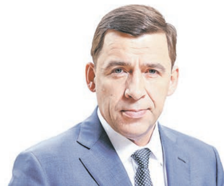
Евгений КУЙВАШЕВ, губернатор Свердловской области

из поздравления с Днем местного самоуправления