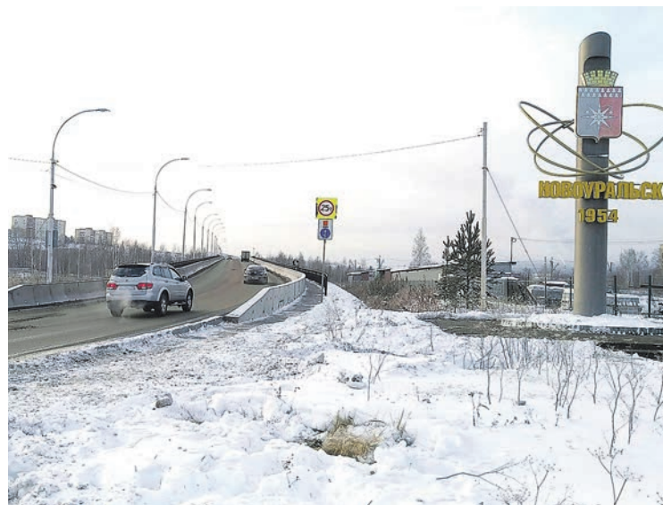
Ремонт моста осуществили в рекордно короткие сроки