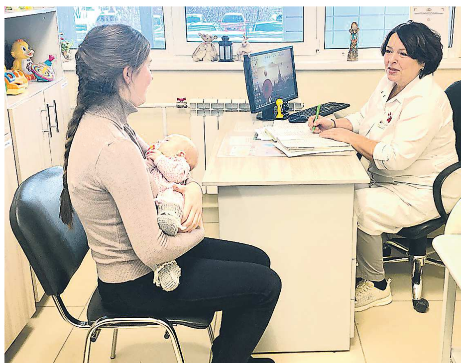
1 700 консультаций было проведено в 2023 году

ПРЕСС-СЛУЖБА МИНИСТРАВА СВЕРДЛОВСКОЙ ОБЛАСТИ