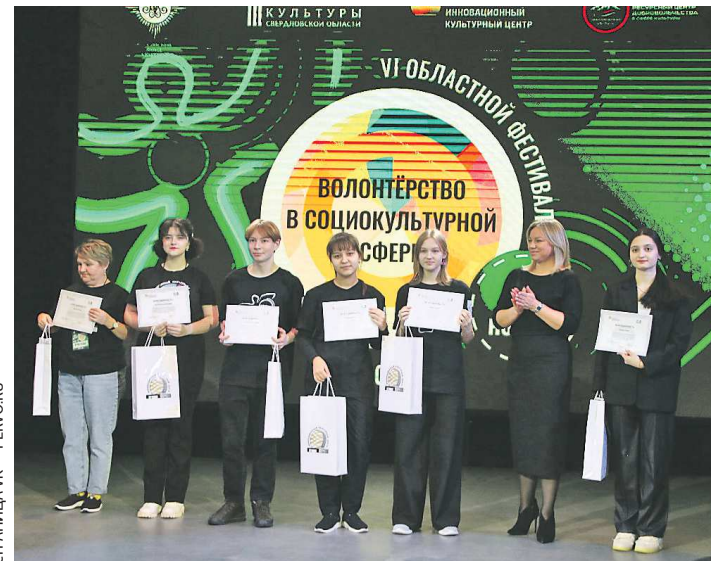
СТРАНИЦА У К – P E R V O R U