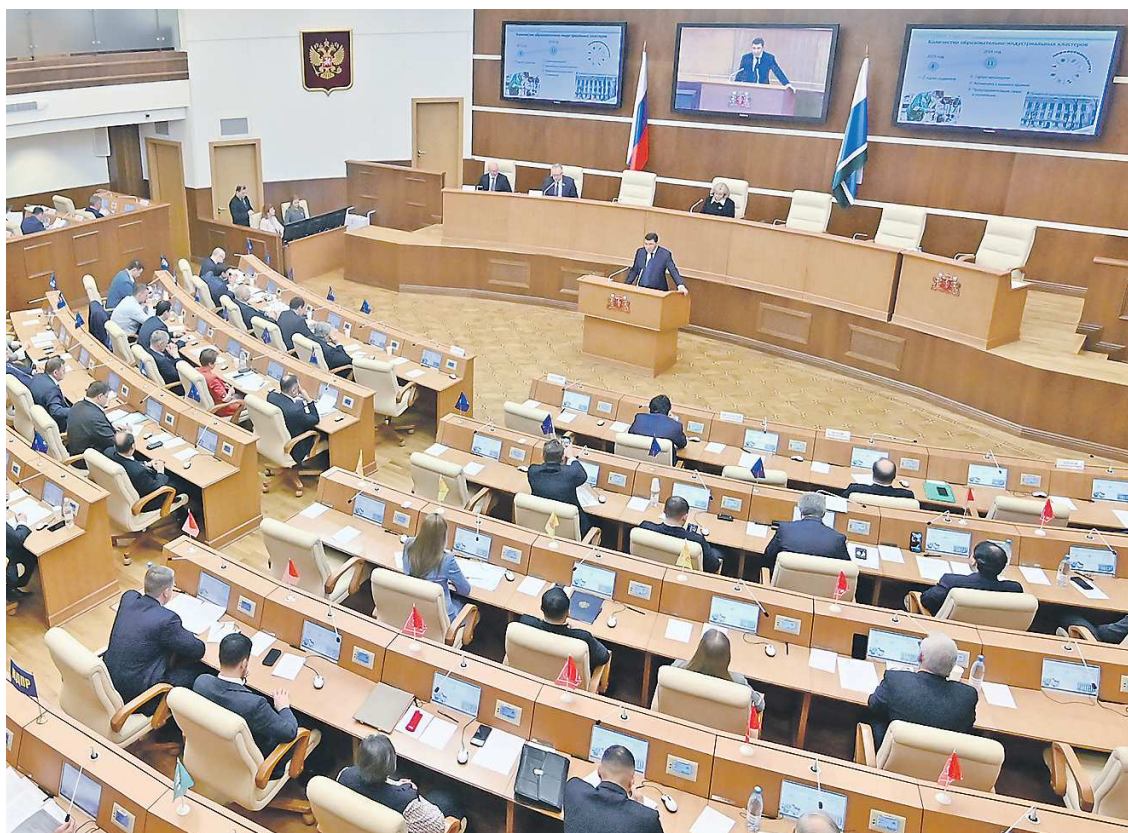
Итоговому рассмотрению бюджета предшествовала большая работа в рамках согласительной комиссии Заксобрани

Депутаты Законодательного Собрания Свердловской области сегодня на очередном заседании планируют принять во втором и третьем, окончательном, чтении законопроект о бюджете региона на 2024 год и плановый период 2025 и 2026 годов. В будущем году расходная часть бюджета впервые в истории превысит 400 миллиардов рублей. Как отмечают эксперты, документ носит ярко выраженную социальную направленность. Принятию закона предшествовала работа согласительной комиссии, на которой было решено направить дополнительно 10 миллиардов рублей на строительство и реконструкцию школ, домов культуры, дорог, спортивных объектов, строительство газопроводов и другие актуальные вопросы.