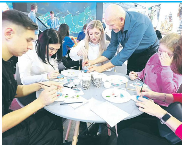
ПРЕСС-СЛУЖБА МИНИСТЕРСТВА СОЦИАЛЬНОЙ ПОЛИТИКИ СО

Свои лучшие практики волонтеры серебряного возраста представили на Международной выставке-форуме «Россия». Для гостей выставки провели спортивную тренировку для улучшения умственной деятельности «Нейробика 55+» от Комплексного центра социального обслуживания города Асбеста. Специалисты Комплексного центра социального обслуживания Ленинского района г. Екатеринбурга организовали интеллектуальную игру «PRO активный пенсионер»: посетителям стенда предстояло применить логическое мышление и ответить на вопросы в формате «мозгобойни». Специалисты Комплексного центра социального обслуживания населения Октябрьского района г. Екатеринбурга представили гостям передовые практики «Социальный туризм 55+» и «Краски жизни», реализуемые в столице Урала для старшего поколения и людей с инвалидностью.