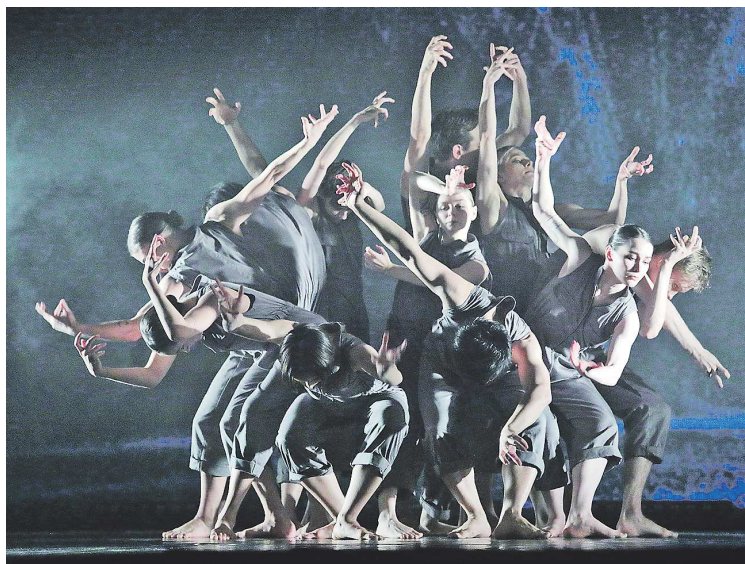
Фрагмент спектакля «Черный сад» Танцевальной компании «Каннон Данс» (Санкт-Петербург)