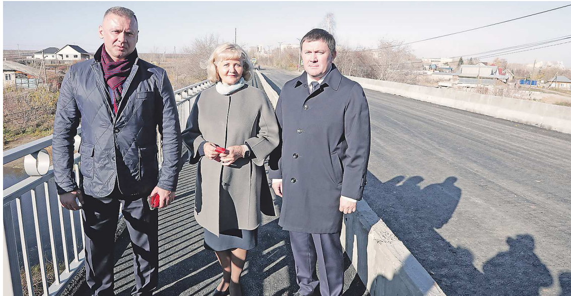
В октябре 2023 года в Богдановиче первый заместитель губернатора Алексей Шмыков (справа), председатель Заксобрания Людмила Бабушкина и глава городского округа Олег Нейфельд открыли после капитального ремонта мост через реку Кунару. В 2024 году допсредства направят на ремонт дорог в муниципалитетах: приятных и полезных открытий для свердловчан будет больше

— Традиционно в бюджет заложены все социальные обязательства, в том числе индексация. Отдельно сегодня выделена индексация расходов на коммунальную инфраструктуру — 9,1 %, это доста-