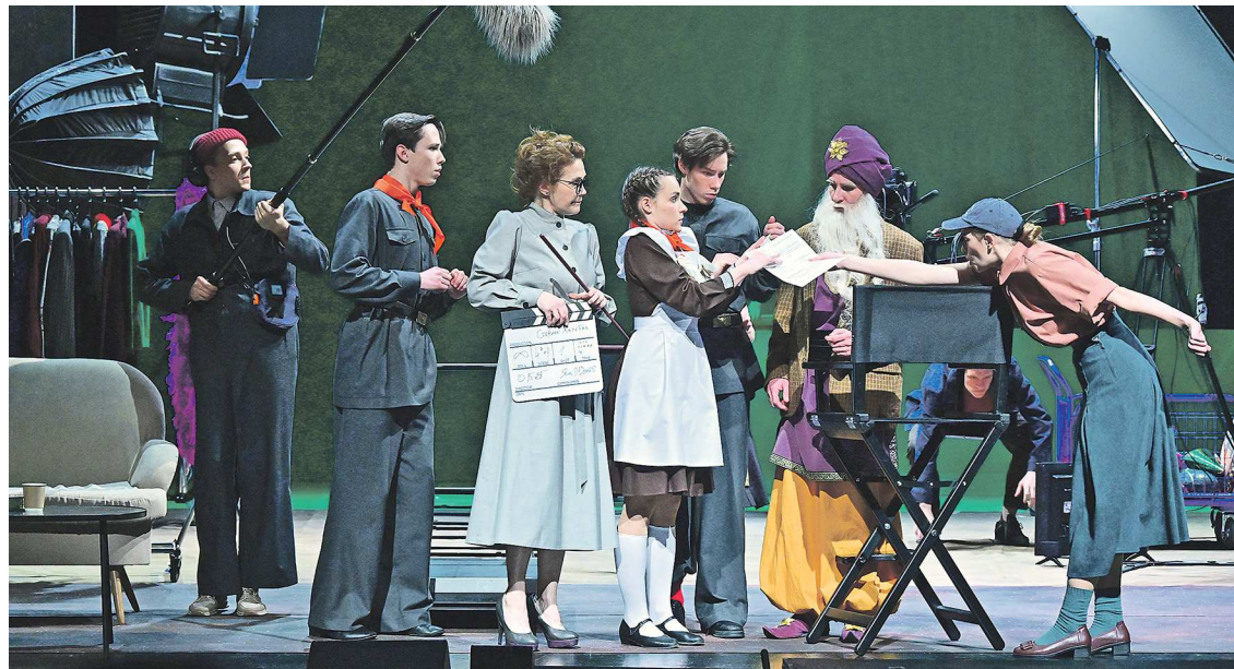
Сцена из спектакля «Старик Хоттабыч»