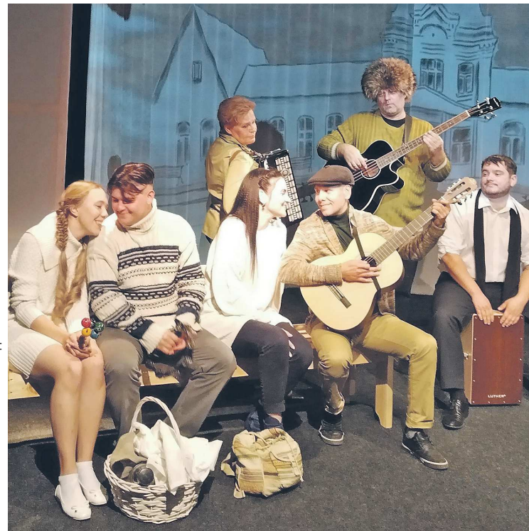
В спектакле «Хорошие люди» (режиссер-постановщик Иван Долгих) зрители узнают и о роли уральских впечатлений в становлении поэта

Спектакль создан при поддержке Государственной стипендии Союза театральных деятелей России.