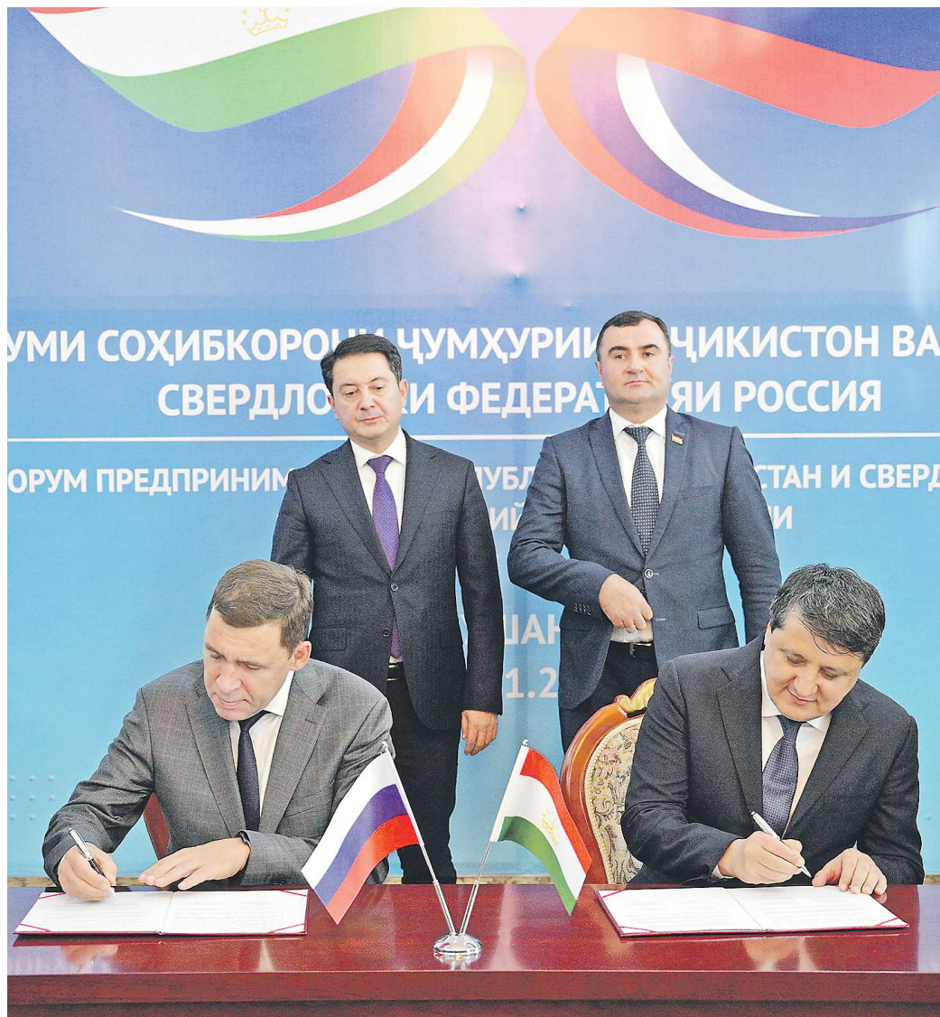
Евгений Куйвашев и министр промышленности и новых технологий Республики Таджикистан Шерали Кабир подписывают протокол о намерениях в установлении сотрудничества

Почти 45 000 свердловчан получили газ по президентской программе