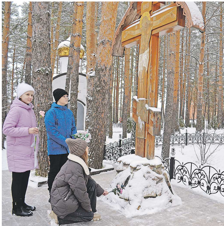
Подростки возлагают цветы к памятному месту

В музее гости попадают в комнаты, где молилась Елизавета Фёдоровна, а князь Сергей Михайлович читал книги. В одной из них экскурсовод предложила