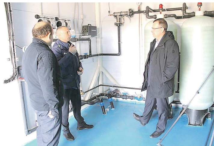
В Ирбитском округе устанавливают станции водоподготовки уже второй год

В деревне Бердюгиной, селе Горки и поселке Зайково заработали новые станции водоподготовки, которые улучшают качество питьевой воды. На их обустройство было затрачено 22 млн рублей.