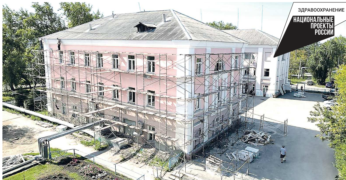
Фасадные работы в Талицкой поликлинике почти завершены

Медучреждение обновляется в рамках нацпроекта «Здравоохранение»