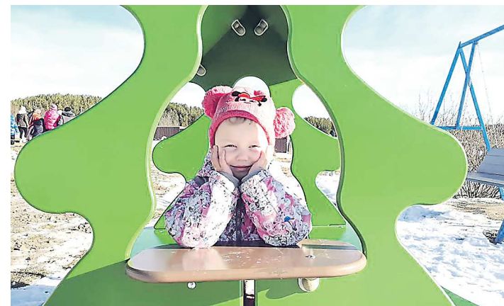
Юные жители Ощепково сразу оценили новую площадку

В деревне Ощепково Режевского района обустроили детскую площадку рядом с местным клубом. С открытием площадки жителей поздравили депутат Госдумы РФ Сергей ЧЕПИКОВ и глава муниципалитета Иван КАРТАШОВ.