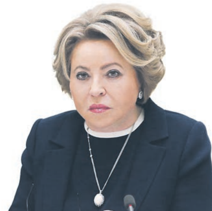
Валентина МАТВИЕНКО, председатель Совета Федерации Федерального Собрания России

“ Газ – это наше национальное достояние. А значит, любой гражданин, где бы он ни проживал, имеет право пользоваться этим национальным достоянием.