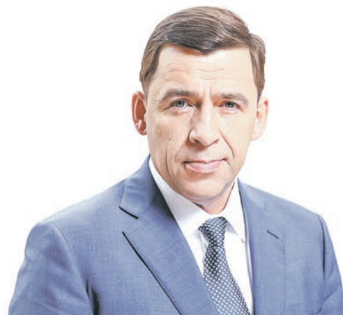
Евгений КУЙВАШЕВ, губернатор Свердловской области

на Петербургском международном газовом форуме