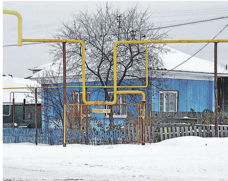
Порядка 101 тысячи домовладений охватит региональная программа по социальной газификации