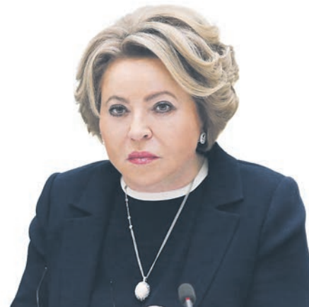
Валентина МАТВИЕНКО, председатель Совета Федерации Федерального Собрания России

“ Газ – это наше национальное достояние. А значит, любой гражданин, где бы он ни проживал, имеет право пользоваться этим национальным достоянием.