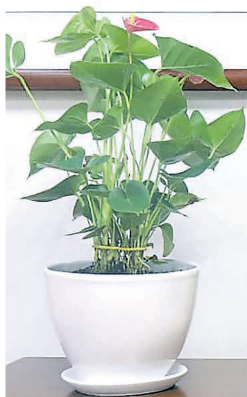
ГЕНЕРАЛЬНОЕ КОНСУЛЬСТВО КНР В Г. ЕКАТЕРИНБУРГЕ / Р.Р.