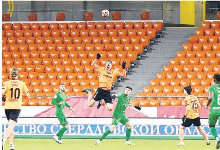
«Урал» продолжает падение в турнирной таблице. После пятого тура команда была на второй позиции, сейчас располагается на 12-й