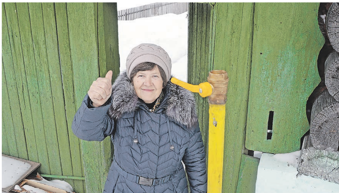
В Свердловской области наиболее активно используют меры социальной поддержки мужчины старше 60 и женщины старше 55 лет

— Суть механизма заключается в том, что управление социальной политики перечисляет субсидию организации, с которой житель заключил договор, а собственник добавляет только недостающую сумму. И если в 2022 году из 1 420 заявок по первому механизму было 1 347, а по второму — 73, то в этом году из 2 965 заявок по второму уже 330