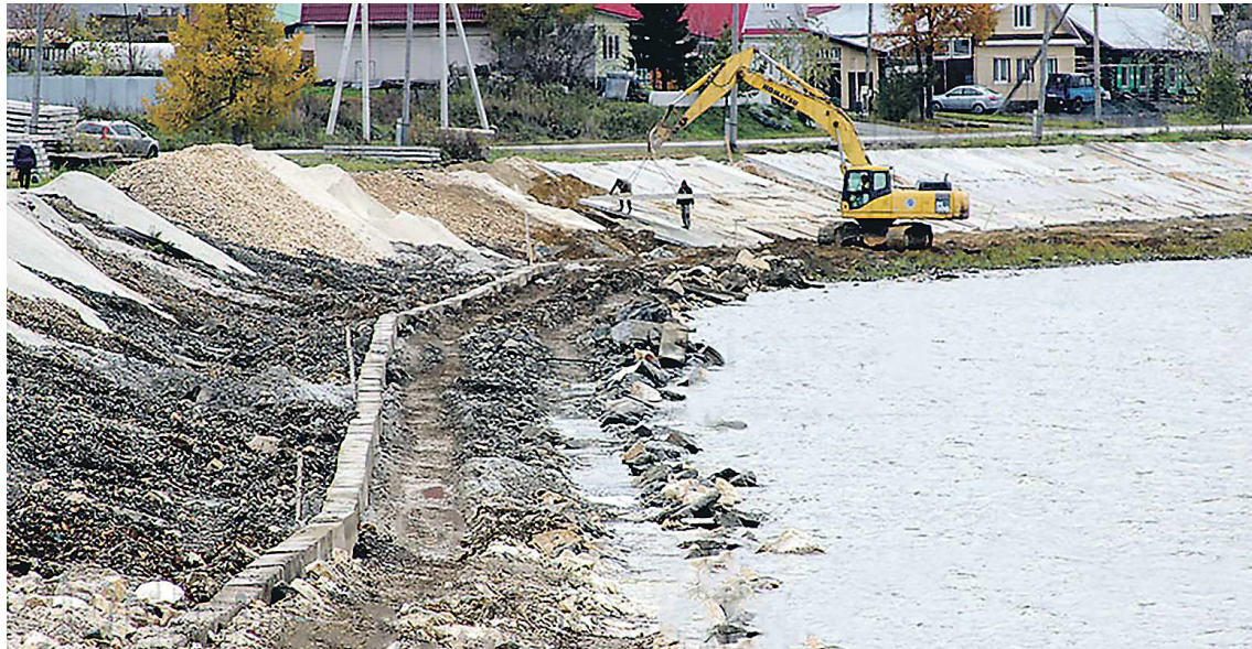
Плотина является стратегическим объектом, и фотосъемка ее ремонта требует специального разрешения. Строители укрепляют береговую линию вблизи сооружения

В Полевском восстанавливают уникальную плотину