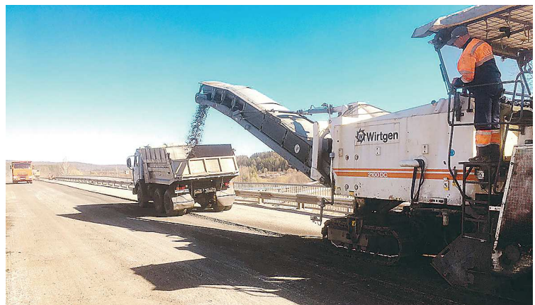
Ремонт автодороги Нижняя Тура – Качканар