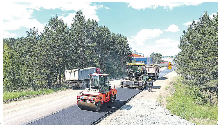
Завершается ремонт автодороги Арамилы – Фомино