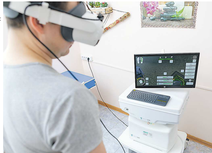
Мультисенсорный комплекс, погружая человека в виртуальный мир, помогает восстановить способность ориентироваться в пространстве

Врожденное плоскостопие усугублялось у девочки физическими нагрузками и причинило сильные боли, к тому же случались и травмы, без которых в спорте не обходится. Спасло восстановительное лечение в «Липовке» в период обострений. Для гимнастки разрабаты-