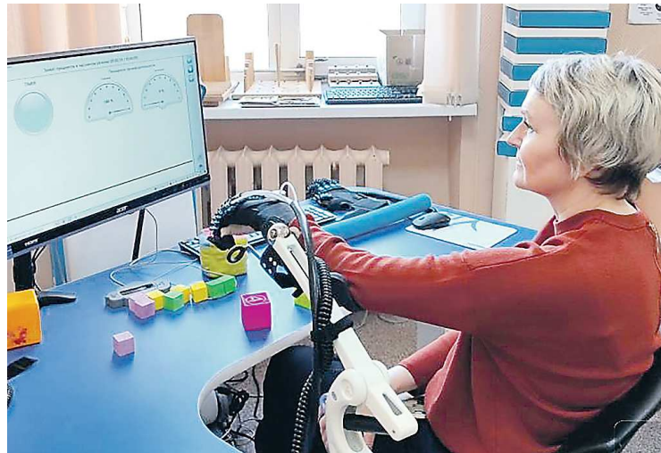
Робот-перчатка помогает быстрее восстанавливать движения рук после инсульта

К примеру, новый тренажер для пальцев и кистей рук стоимостью почти 12 млн рублей позволяет восстановить работу верхних конечностей. В роботизированную систему входит перчатка, через которую поступают импульсы, заставляющие выполнять движения, специальный стол, монитор и системный блок. При выполнении упражнений с чудо-перчаткой активизируется сила и объем движений в суставах, вос-