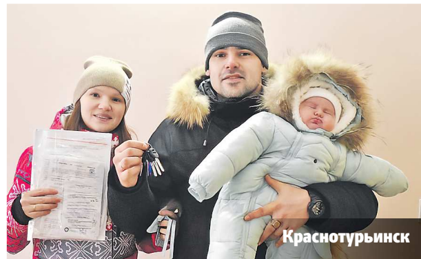
Треть красногурьевских новоселов – молодые семьи с детьми

Сдача дома для бюджетников запланирована на конец лета 2024 года. У дома оборудуют парковку на 40 мест, установят игровую и спортивную площадки. Стоимость проекта составляет более 170 млн рублей.