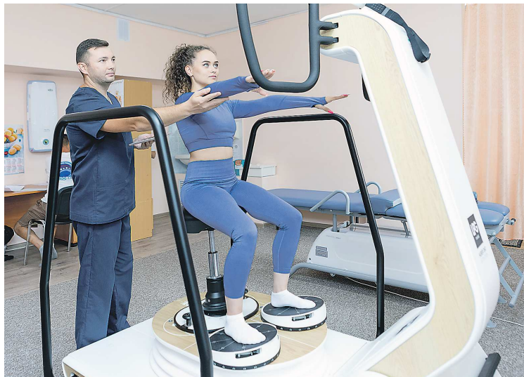
Стабилоплатформа «Хубер 360» обеспечивает восстановление баланса и равновесия после затяжного периода без движения

В индивидуально разработанную программу реабилитации женщины были включены занятия на двух уникальных аппаратах, закупленных по федеральному проекту. Кинезиотерапевтическая система последнего поколения «Хубер 360», созданная на основе биомеханической подвижной платформы, позволила «включить» отвыкшие от работы гибательные и разгибательные мышцы. Аппарат механотерапии для пассивной тренировки суставов «Ормед ФЛЕКС» помог увеличить амплитуду движений.