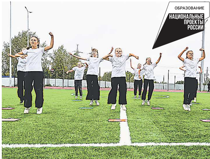
Юные спортсмены Ивделя выступают на новом стадионе в день его открытия

В ивдельской школе № 2 за лето построили новый стадион. Его стоимость составила 25,6 млн рублей. Теперь для учащихся есть все условия для занятий физкультурой и спортом.