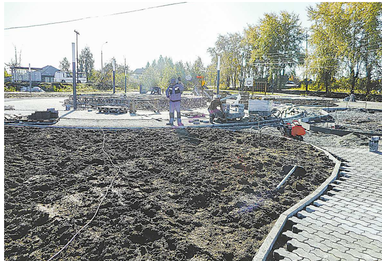
Строители подводят сети к сцене в центре новой площадки

По данным местной газеты «Новая жизнь», проект реализует опытная бригада строителей, которые уже благоустроили площадку в селе Кордюково, территорию напротив Верхо-