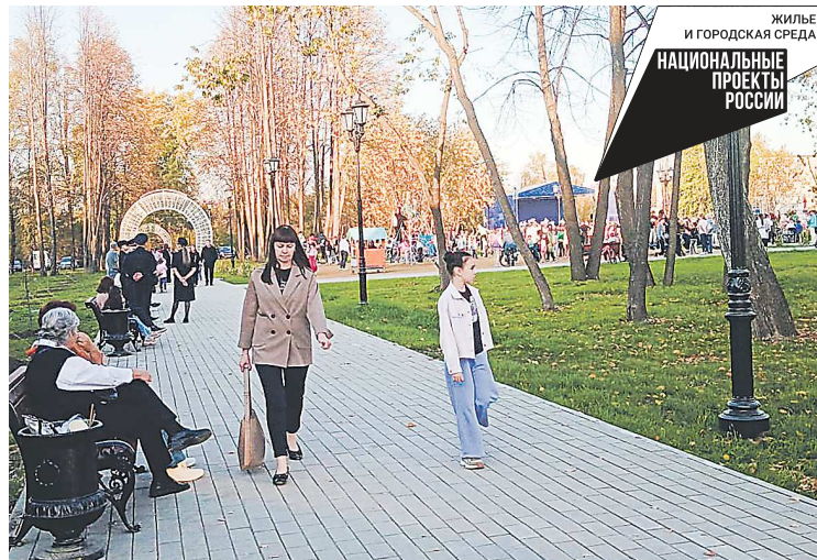
Одним из арт-объектов площади стали световые арки на дорожках, сквозь которые проходят жители

На площади организовали несколько функциональных зон: для проведения массовых мероприятий, прогулочная зона с аллеей и пешеходными дорожками, мемориальная зона — с обновленным памятником Ленину, детская игровая зона и пр. Для жителей установили скамейки, качели, домик-беседку, уличные фонари, современный сборно-разборный сценический комплекс и многое другое. Территорию заасфальтировали, уложили дорожную плитку.