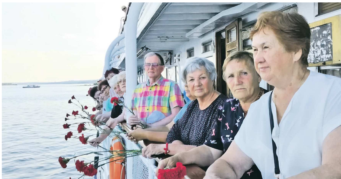
В этом году 148 активистов ветеранского движения Свердловской области укрепят свое здоровье

Поездке предшествовала большая работа сотрудников СООО ветеранов: были распределены квоты по ветеранским