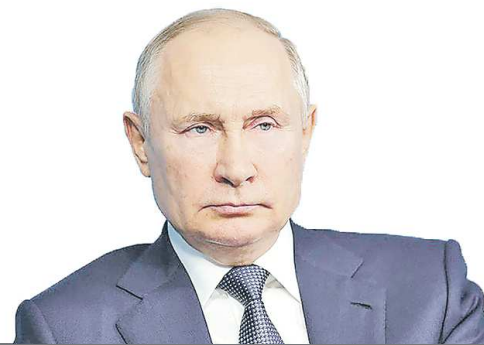
Владимир ПУТИН, Президент России

« Помогать пожилым и быть к ним внимательным очень важно для общества, это делает его эффективным, а детей общение с пожилыми учит быть добрыми, а также дает возможность узнать много полезного от людей с богатым жизненным опытом.