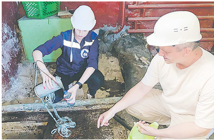
Специалисты первоуральского Водоканала берут пробы воды на вводе в многоквартирный дом по улице Ильича

– Дело в том, что третий год подряд на Среднем Урале наблюдаются малоснежная зима и затем засушливое лето. Как следствие, происходит обмеление водоемов. Первоуральск всегда потреблял воду из двух источников – Верхне-Шайтанского водохранилища и нижнесергинских подземных скважин. Из первого источника вода проходила через насосно-фильтровальную станцию, чтобы очиститься от примесей, из второго поступала сразу потребителям, поскольку она артезианская и чистая изначально. Этим летом уровень воды в Верхне-Шайтанском водохранилище упал с семи метров до че-