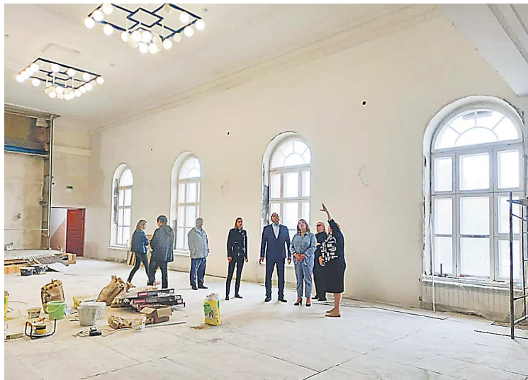
Широкие панорамные окна, «зашитые» строителями раньше, значительно добавили света помещению

Сцену в зале будут расширять, а помещение бывшей киноаппаратной переоборудуют под звукооператорскую. При этом один из старых киноаппаратов передадут в местный музей – на память. Также планируется установка нового звукового и светового оборудования.