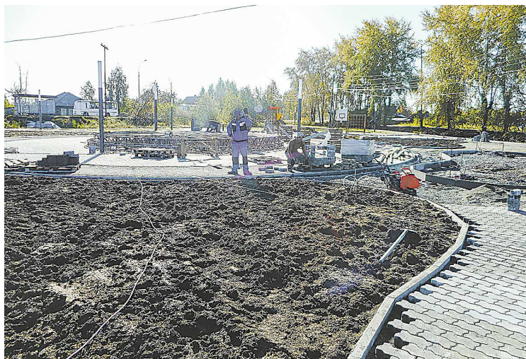
Строители подводят сети к сцене в центре новой площадки

По данным местной газеты «Новая жизнь», проект реализует опытная бригада строителей, которые уже благоустроили площадку в селе Кордюково, территорию напротив Верхо-