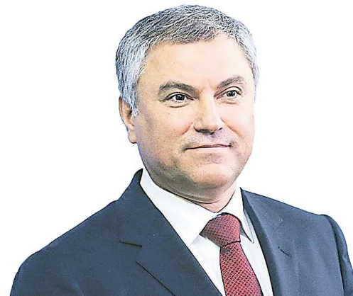
Вячеслав ВОЛОДИН , председатель Государственной думы РФ

“Города – двигатель развития страны. Именно в них создается большая часть ВВП. От того, насколько комфортной мы сможем сделать жизнь в городах, в том числе удаленных от центра региона, зависит развитие страны. Города должны бороться за человека и конкурировать между собой.