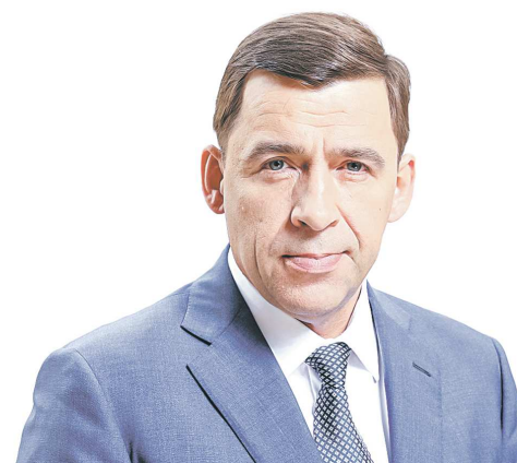
Евгений КУЙВАШЕВ , губернатор Свердловской области

на заседании Совета по развитию городских территорий и общественных пространств