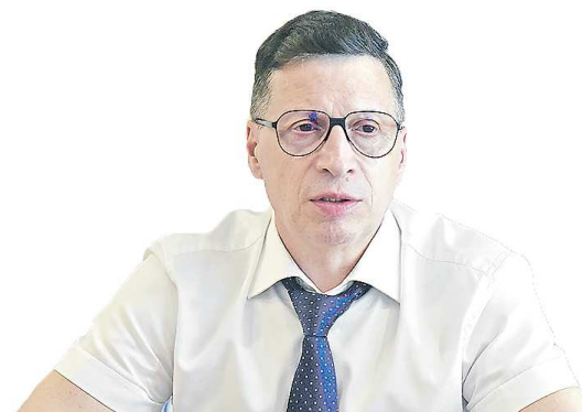
Леонид РАПОПОРТ, министр физической культуры и спорта Свердловской области

« Вопросы укрепления здоровья населения, и особенно представителей молодого поколения, по праву находятся в числе значимых приоритетов государственной политики. Отрадно, что весомый вклад в решение этой важнейшей проблемы, в продвижение ценностей здорового образа жизни в российском обществе вносят Российский футбольный союз и Ассоциация мини-футбола России.