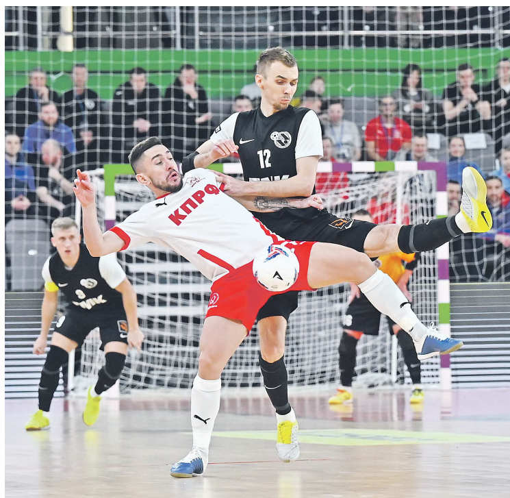
Матчи «Синары» и «КПРФ» всегда получаются яркими и бескомпромиссными

В чемпионате страны «Синара» и «КПРФ» стартовали с побед. Екатеринбургцы в первом