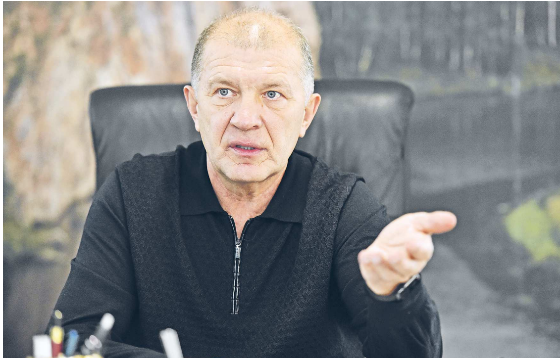
Григорий Иванов был избран президентом новой Суперлиги

С нынешнего сезона исчезли ничейные результаты. В случае