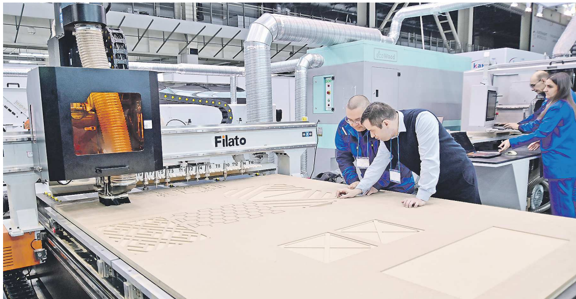
На выставке представлено более 40 единиц современного высокотехнологичного оборудования для обработки дерева

– Свердловская область – перспективная площадка для производителей мебели. Сегодня объем деревообрабатываемой продукции в регионе оце-