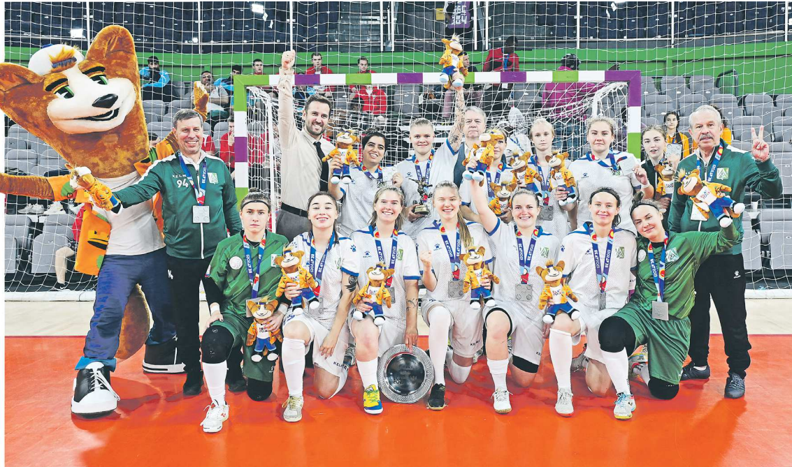
Команда УГЛУ – серебряный призер Международного фестиваля университетского спорта. До золота не хватило совсем чуть-чуть: в финале екатеринбургенки проиграли со счетом 1:2, пропустив решающий мяч в овертайме

Инициатором создания проектов выступила Ассоциация мини-футбола России (АМФР), коллективный член Российского футбольного союза (РФС).