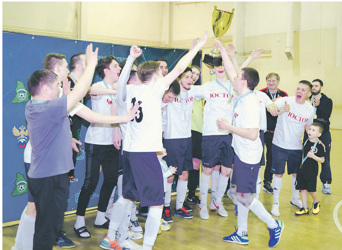
ЮСТОР из Каменска-Уральского с трофеем за победу в чемпионате Свердловской области

Восемь дивизионов чемпионата Екатеринбурга и региональное первенство готовы к старту нового сезона