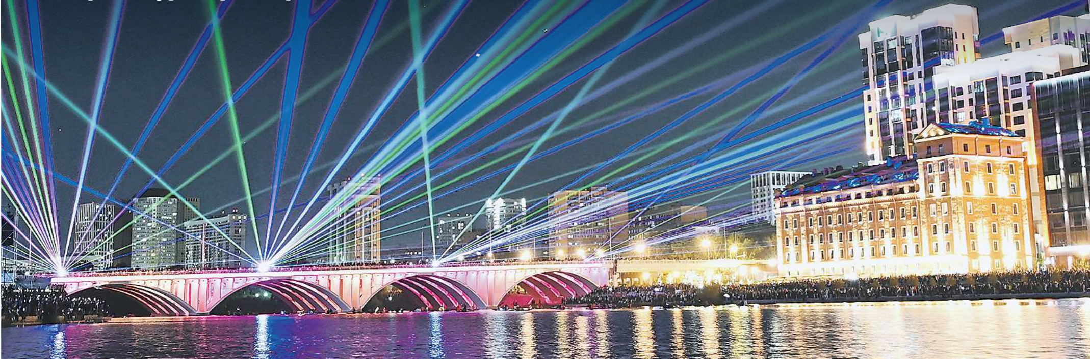
Иллюминация на Макаровском мосту, построенном в 1959 году. Длина сооружения – 255 метров. В 2021 году его открыли после пятилетней реконструкции