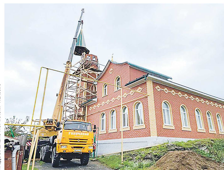
Сводчатую треугольную крышу минарета устанавливали краном