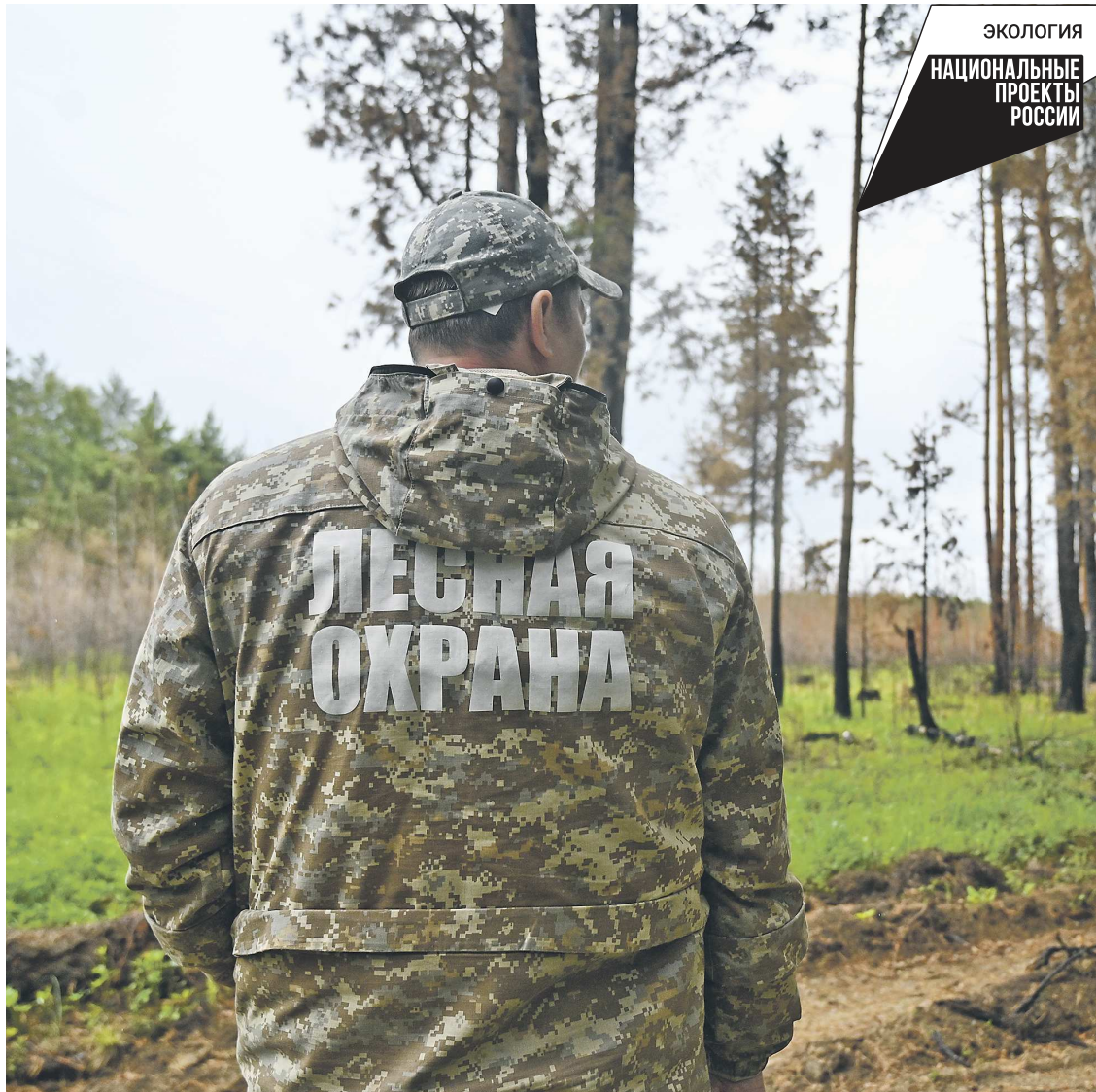
Всего в 30 лесничествах Свердловской области работают 356 инспекторов