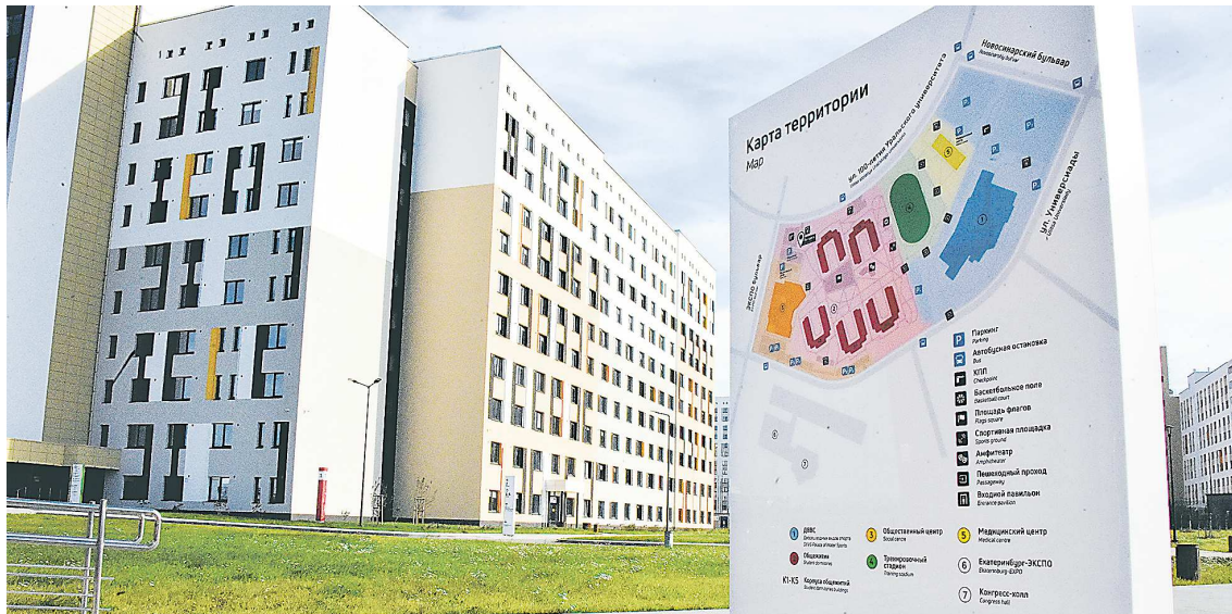
Рядом с общежитиями (на фото) находятся спортивный манеж, спортзал и Дворец водных видов спорта

Еще три здания общежитий продолжают готовить, также неподалеку идет стройка – в 2025-2026 годах должна открыться вторая очередь кампуса, куда переедут Специализированный