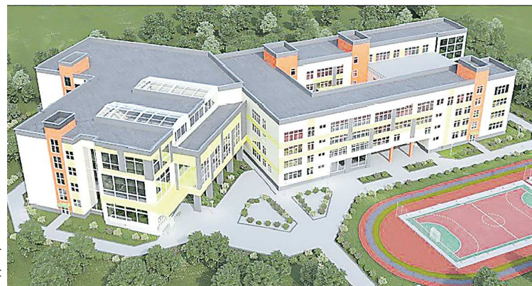
После реконструкции школа преобразится кардинально

С 2022 года в Верхней Пышме реконструируют школу № 4. Это первый проект в сфере образования, который реализуется на условиях государственно-частного партнерства при поддержке губернатора Евгения КУЙВАШЕВА . Благодаря реконструкции площадь образовательного учреждения увеличится в 2,5 раза и в нем смогут обучаться 1 135 детей.