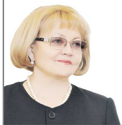
Председатель Законодательного Собрания Свердловской области