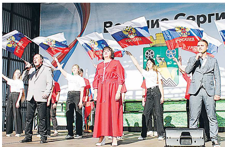
О новой просторной сцене творческие коллективы округа мечтали давно

Нынче на общественной территории установили сцену для выступлений творческих коллективов и проведения различных мероприятий. Она стоит на металлических конструкциях, имеет крышу, вмещает несколько десятков человек. Ширина