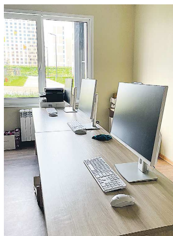
На каждом этаже новых корпусов предусмотрены учебные комнаты