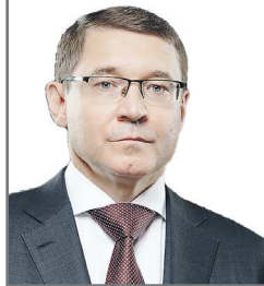
Полномочный представитель Президента России в Уральском федеральном округе