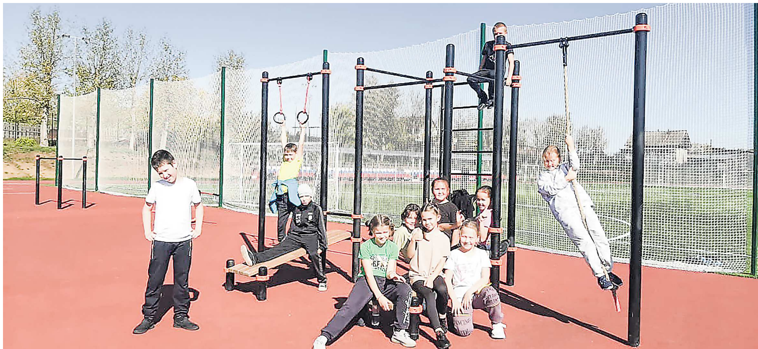
Новая спортплощадка в Русской Тавре уже стала точкой притяжения молодежи

В селе Юва в рамках нацпроекта «Образование» капитально отремонтирован школьный спортзал. Ранее он был очень холодным (зимой температура воздуха не поднималась выше +10 градусов) и неудобным – с темными, мрачными стенами. За лето