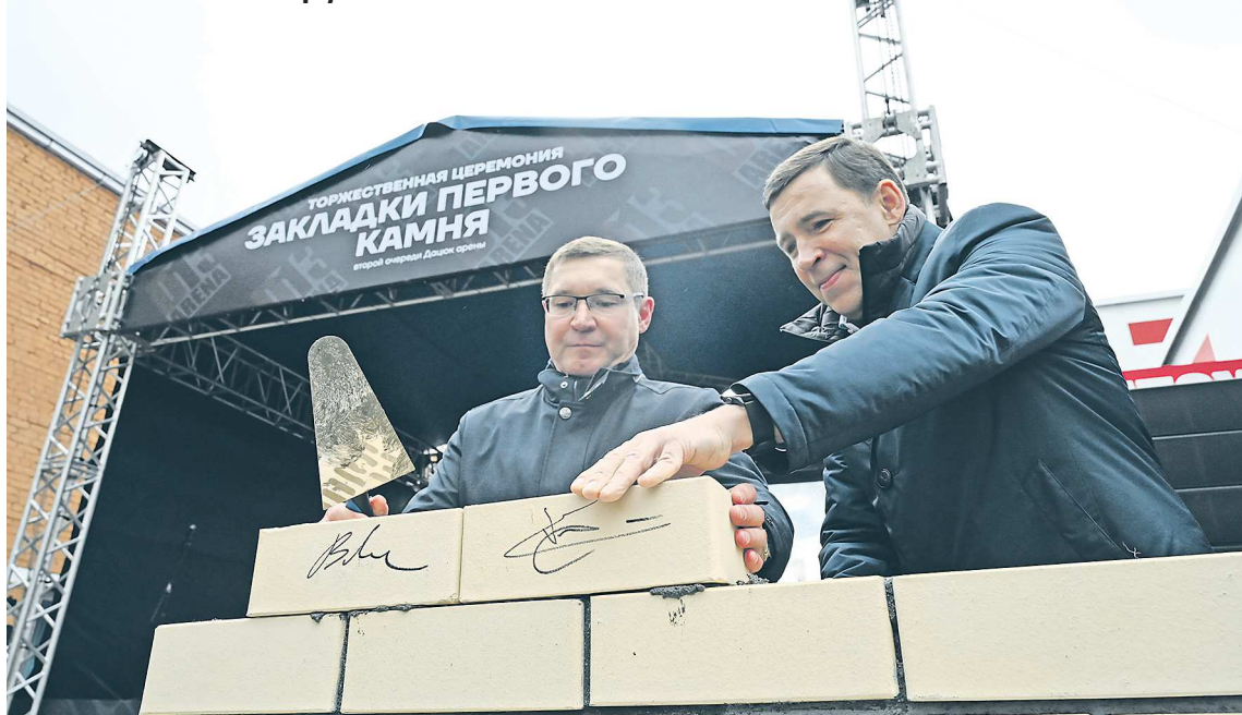
Полномочный представитель Президента РФ в УрФО Владимир Якушев и губернатор Свердловской области Евгений Куйвашев во время закладки первого камня в основание второй очереди «Дацюк Арены»

На строительство второй очереди объекта направлено 350 миллионов рублей