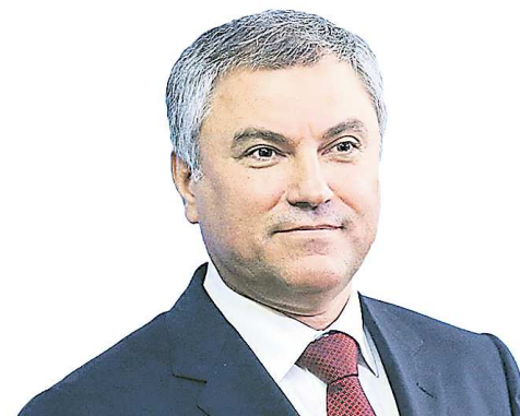
Вячеслав ВОЛОДИН, председатель Государственной Думы Российской Федерации

“ Людям нужны комфортные условия жизни, независимо от того, в какой части города проживают... <> Независимо от того, в каком микрорайоне живет человек, там должно быть все, чтобы он чувствовал себя комфортно: детский садик, школа, поликлиника, спортивный зал, музей, пространство со скверами и парковыми зонами.