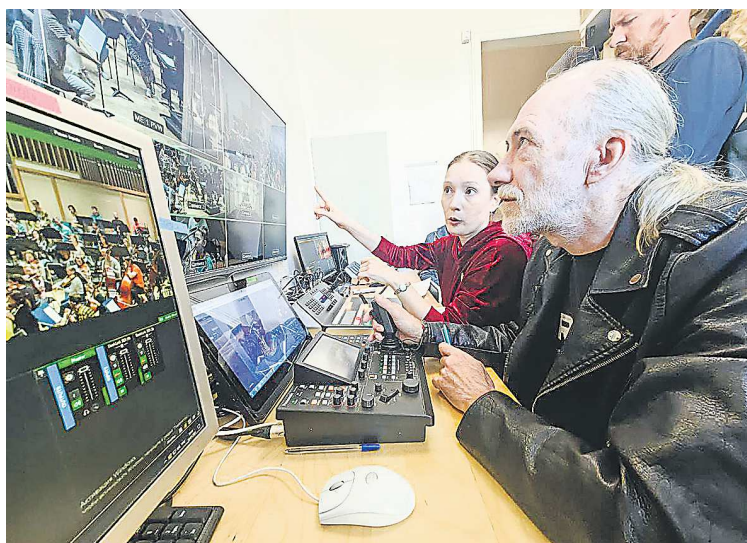
В аппаратной Виртуального зала Свердловской филармонии заканчиваются последние приготовления к трансляциям концертных вечеров

«симфония болезненно воздействует на советского слушателя». Симфония будет впервые исполнена в Екатеринбурге.