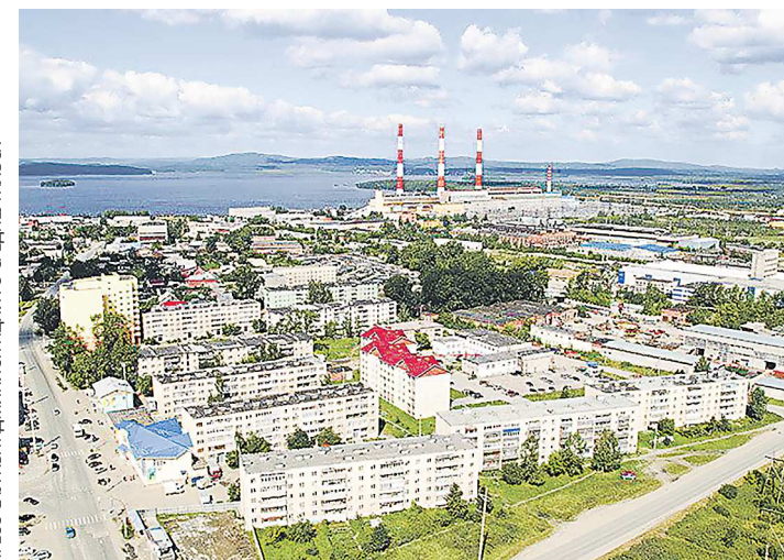
Среднеуральск – город-спутник Екатеринбурга. Это город энергетиков, где работает тепловая электростанция федерального значения

11 сентября в Среднеуральске прошел первый этап конкурсного отбора на пост главы муниципалитета. Конкурсная комиссия проверила представленные претендентами документы. Второй этап конкурса состоится 25 сентября, где депутаты местной думы должны принять итоговое решение.