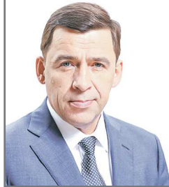
Губернатор Свердловской области

В Свердловской области в рамках национального проекта «Экология» запланировано 100% лесовосстановление площади вырубленных и погибших лесных насаждений. К настоящему времени восстановлено 6,3 тысячи гектаров леса. Всего в 2023 году для восстановления лесов Свердловской области высадят более 24 миллионов сеянцев хвойных деревьев.