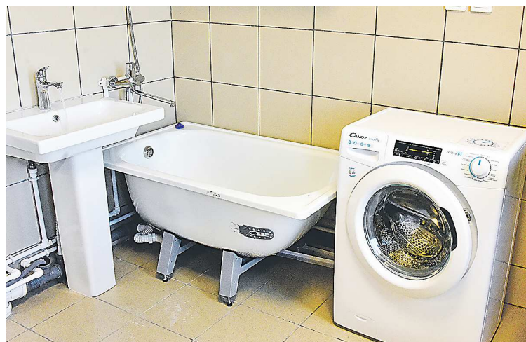
На каждом этаже для удобства студентов расположены прачечные с необходимым оборудованием

Создание кампуса мирового уровня – это часть большой программы, инициированной губернатором Евгением Куйвашевым , по превращению Екатеринбурга в студенческую столицу России. Проект реализуется по поручению Президента России Владимира Путина в рамках нацпроекта «Наука и университеты» и предполагает формирование мощного научно-образовательного кластера.