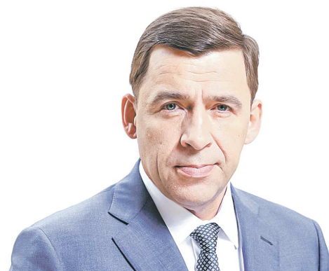
Евгений КУЙВАШЕВ, губернатор Свердловской области

На заседании Совета по развитию городских территорий и общественных пространств