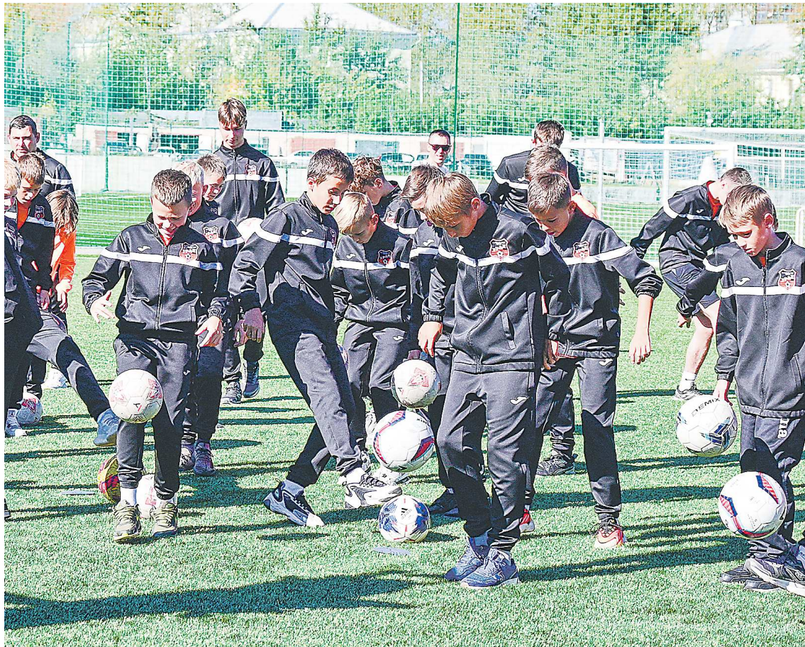
В заключение церемонии открытия юные футболисты показали гостям свое умение жонглировать мячом