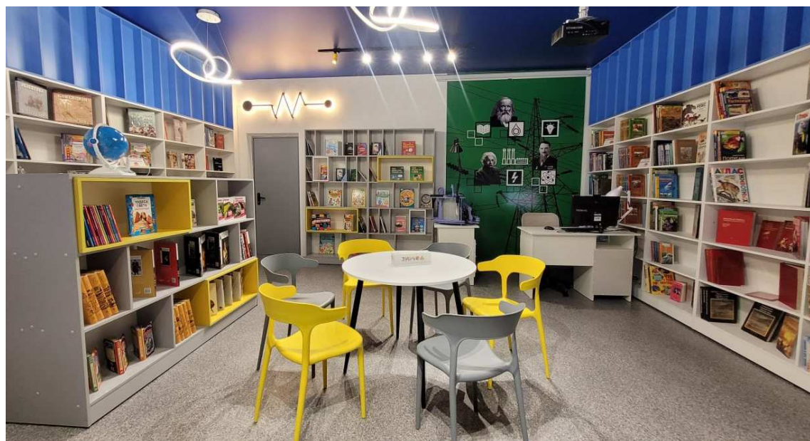
Все интерьеры модельных библиотек выполняются в современном стиле с использованием оригинальной параметрической мебели и бионических плавных форм, которые создают комфортную среду