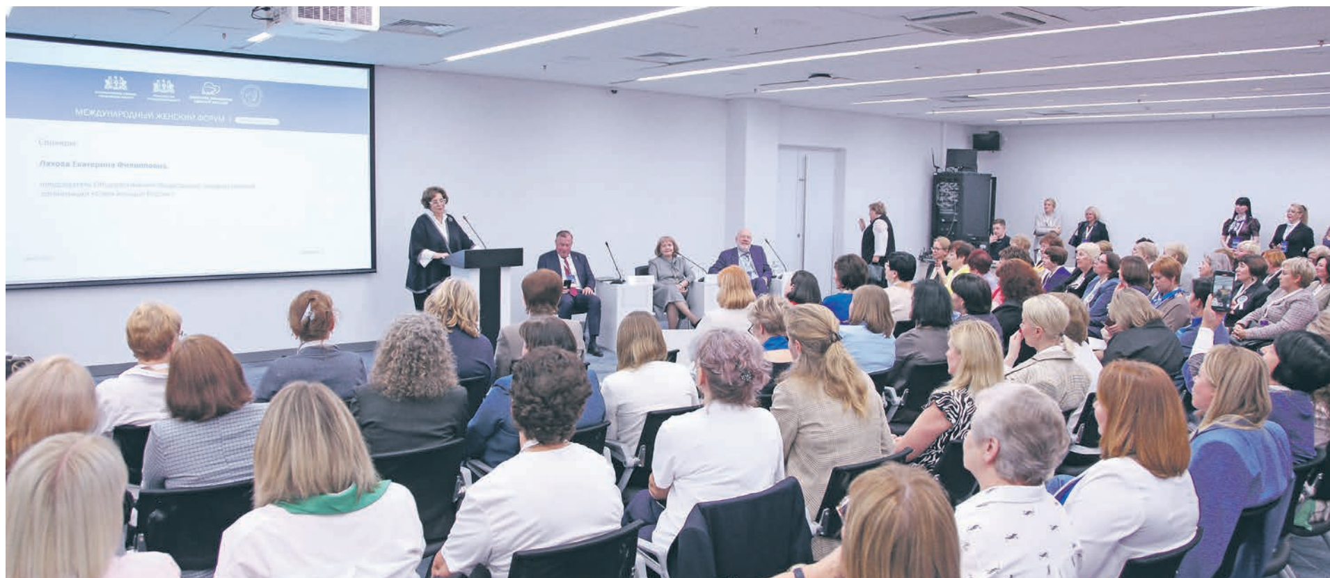
ПРЕСС-СЛУЖБА ЗАКОНОДАТЕЛЬНОГО СОБРАНИЯ СВЕРДЛОВСКОЙ ОБЛАСТИ

Председатель Законодательного Собрания Свердловской области Людмила БАБУШКИНА приняла участие в заседании секции «Женщины в современной политике и развитии законодательно-правового механизма на региональном и федеральном уровнях», состоявшемся в рамках Международного женского форума «Роль женщин в современном мире».