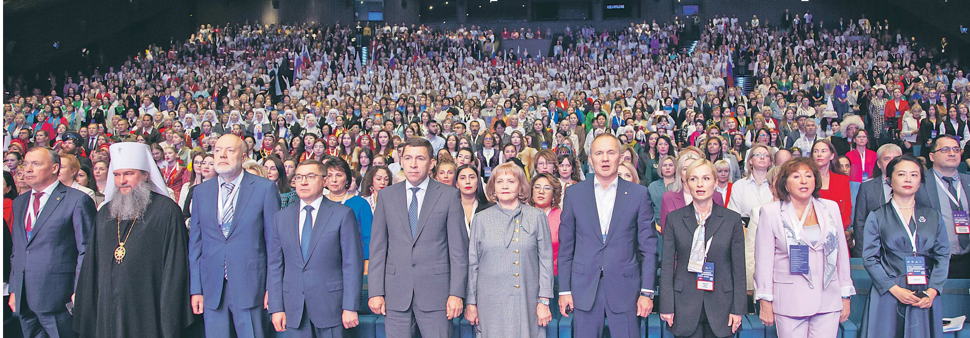
ПРЕСС-СЛУЖБА ЗАКОНОДАТЕЛЬНОГО СОБРАНИЯ СВЕРДЛОВСКОЙ ОБЛАСТИ