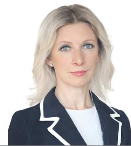
Мария ЗАХАРОВА, официальный представитель МИД России

« Динамично меняющийся мир ставит задачи, в решении которых значительная роль отводится женщинам. Нет, наверное, таких областей деятельности, в которых представительницы не достигли бы значимых, а зачастую выдающихся результатов для общего блага. И Международный форум «Роль женщин в современном мире», проходящий в столице Свердловской области, станет эффективным механизмом дальнейшего международного сотрудничества. Со своей стороны, поддерживаю инициативу – сделать нашу встречу в Екатеринбурге ежегодной и готова оказывать этому всемерное содействие.