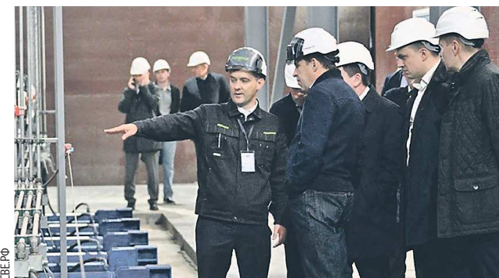
На новом предприятии установлено самое современное, экологически безопасное оборудование, рассказали сотрудники Евгению Куйвашеву (в центре). Оно позволит не только перерабатывать большие объемы древесных отходов, но и вырабатывать тепловую энергию