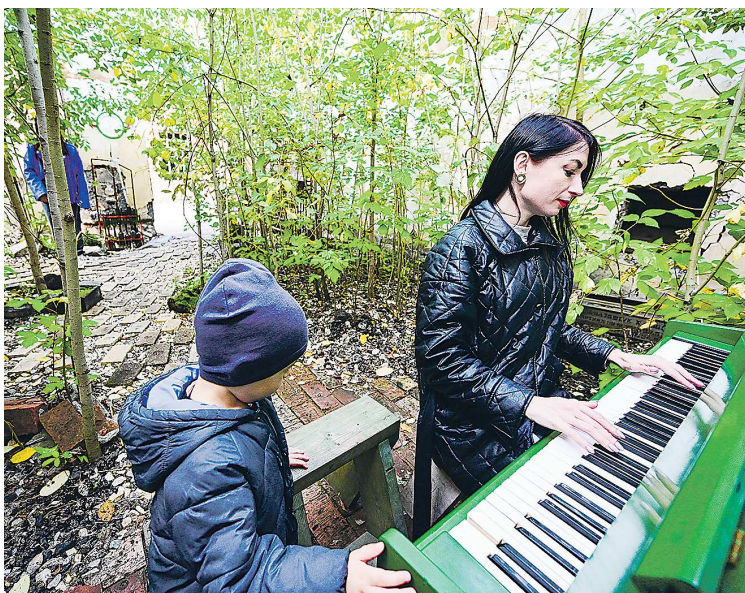
Согласно мастер-плану развития кластера предполагается, что люди смогут сами выбирать интересный им формат отдыха

тров. Эти границы определены по итогам анализа территории, действующих туристических предложений и планов развития бизнеса и муниципальных образований. Всего на территории создаваемого кластера постоянно проживает около 300 тысяч человек, а плановый турпоток к 2038 году при реализации проекта должен составить 2,8 миллиона посетителей в год. Планируется создать более 10 тысяч новых рабочих мест.