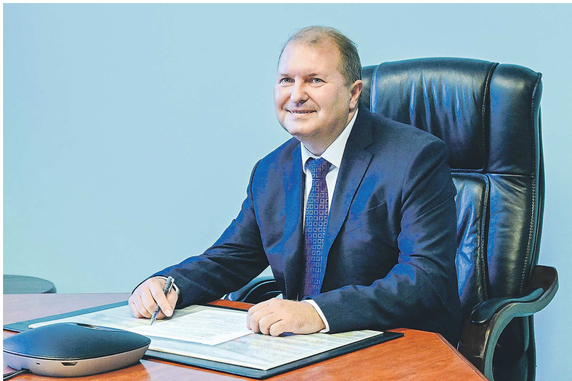
Александр Старков – министр финансов Свердловской области

– В первую очередь социальные. В приоритете – безусловное выполнение поручений Президента России, губернатора Свердловской области. Это касается индексации социальных пособий и льгот, зарплата работников бюджетной сферы. Другой блок – это инвестиционные расходы. Можно сказать, что 2024 год – это год досрочного ввода в эксплуатацию крупных объектов. Сегодня федерация выдает регионам, в том числе и нашему, бюджетные кредиты, средства которых направляются на дороги, транспорт, строительство школ и других важных объектов. Напомню, данная мера поддержки введена в 2023 году, средства субъектам РФ выделяются до 30 апреля 2024 года под 0,1 процента годовых. Планируем привлечь такой кредит в текущем году в сумме 3 миллиарда рублей. Также за счет средств специального казначейского кредита мы ожидаем поставку в города Свердловской области автобусов, это как раз один из траншей федерального кредита. Отмечу, коммерческих кредитов сегодня у Свердловской области нет.