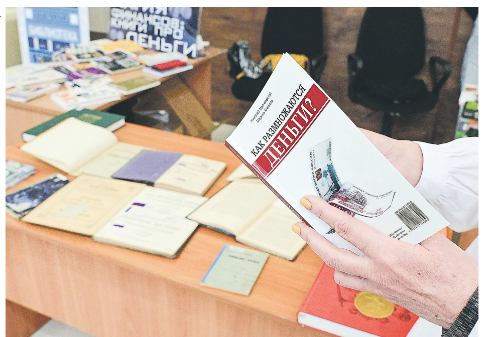
В честь Дня финансиста Библиотека имени Белинского организовала выставку «Магия финансов: книги про деньги» в министерстве финансов региона