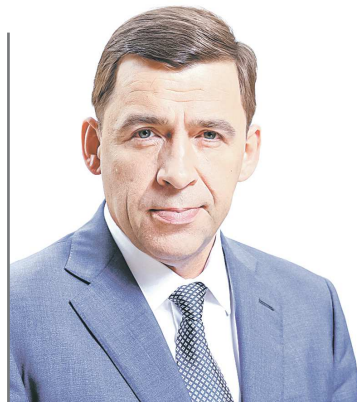
Губернатор Свердловской области Евгений КУЙВАШЕВ