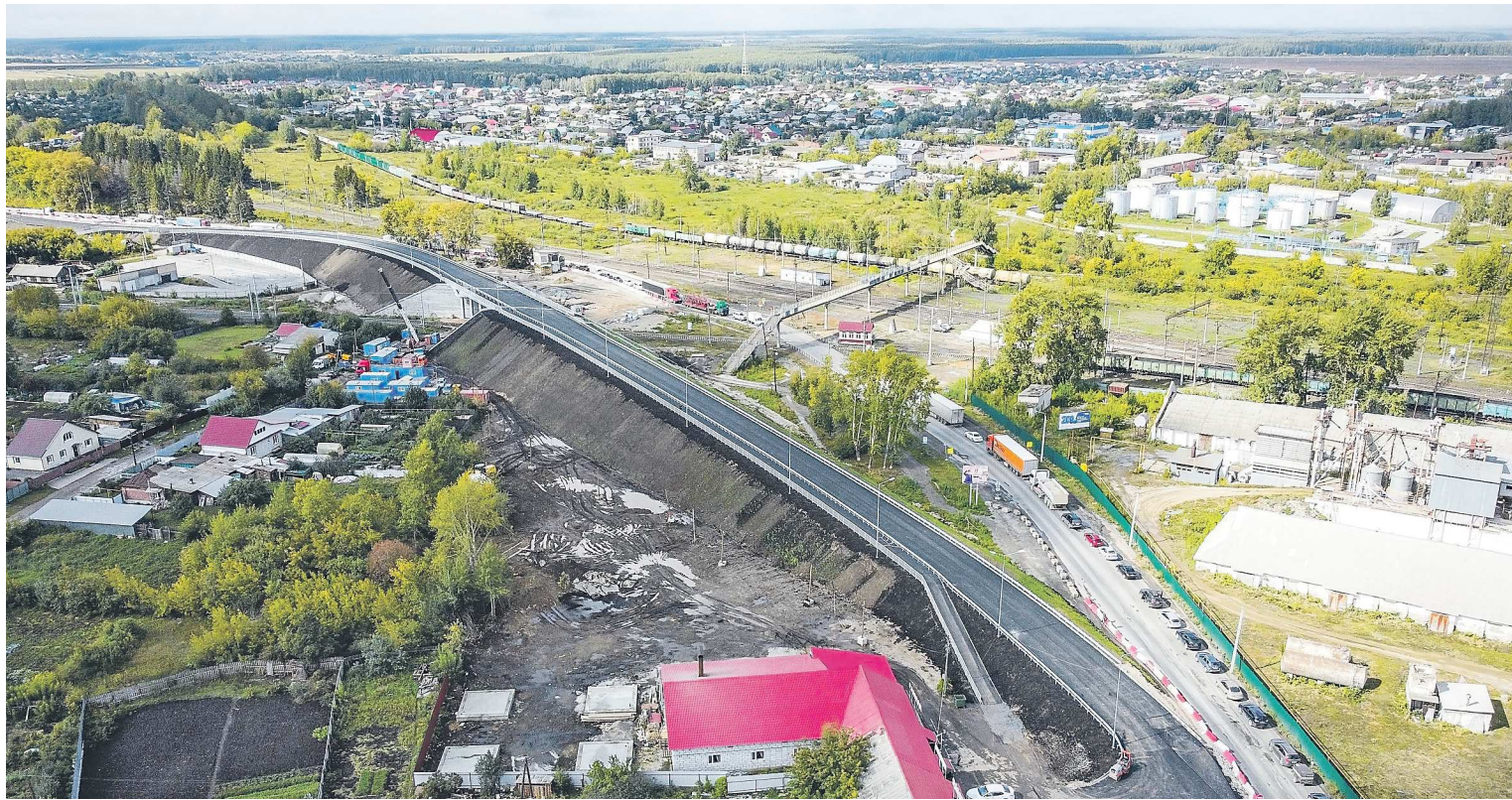
Теперь у Богдановича есть альтернативный проезд для транспорта, и пробок у железнодорожного переезда уже не будет