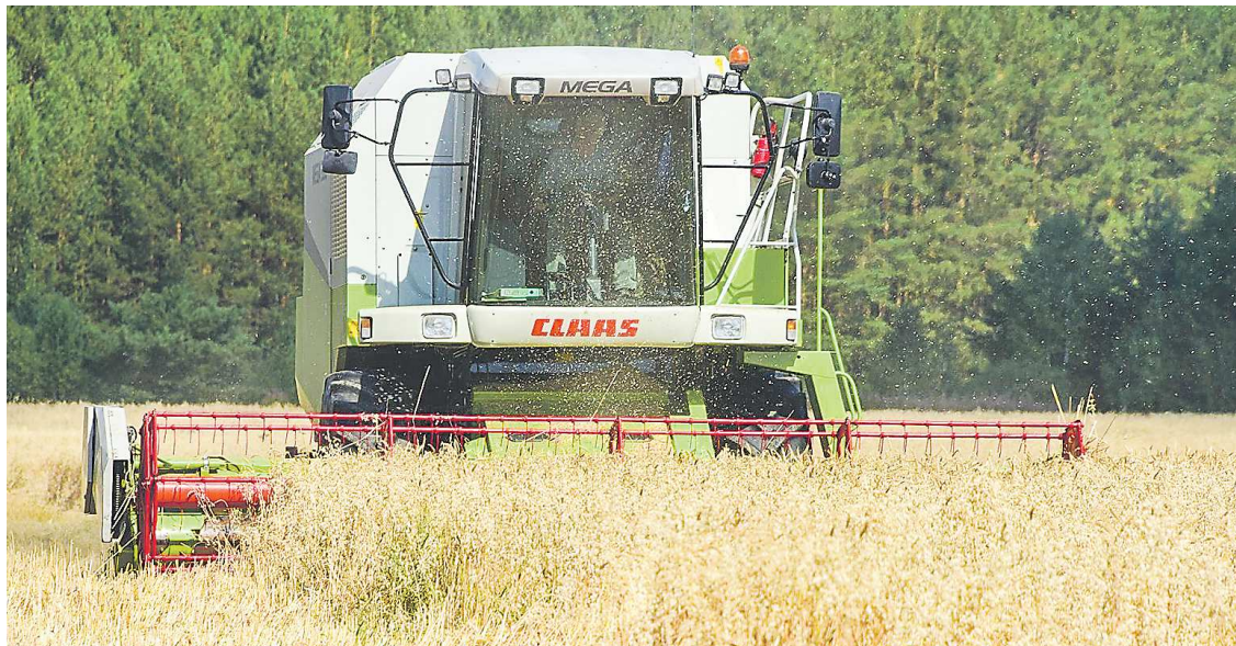
Заготовка кормов для животных: на поля вышла техника агрохолдинга «Каменское»

Между тем, несмотря на жаркую погоду, уральские аграрии сумели сохранить посевы. Сей-