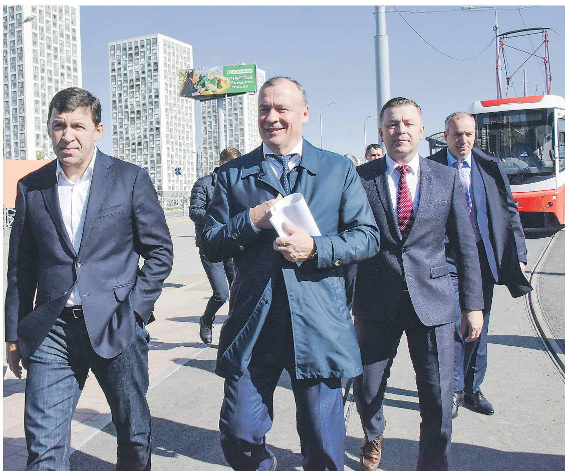
На трамвайную остановку в Академический Евгений Куйвашев прибыл в сопровождении мэра Екатеринбурга Алексея Орлова и министра транспорта региона Василия Старкова (слева направо)

Почти 2,7 млрд рублей направлено на строительство новой школы в Екатеринбурге